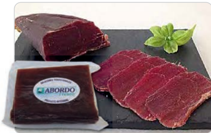
C-4459 MOJAMA DE ATÚN ESPECIAL PRIMERA (1 kg aprox.)