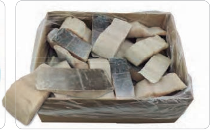
C-1254 SUPREMAS DE FOGONERO (PUNTO DE SAL) (150/180 g/pza.)