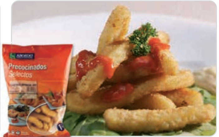
C-6488 RABAS DE CALAMAR EMPANADAS Bolsa 1 kg