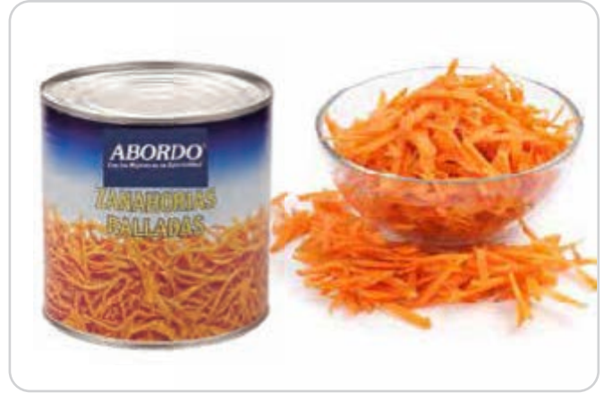
C-9993 ZANAHORIA RAYADA Lata 3 kg Caja: 3 Latas / El kg le sale a 0,58 €

Una buena forma de incorporar vegetales a la nuestra dieta y cubrir las necesidades de vitaminas y minerales que nos aportan, es el consumo de encurtidos.