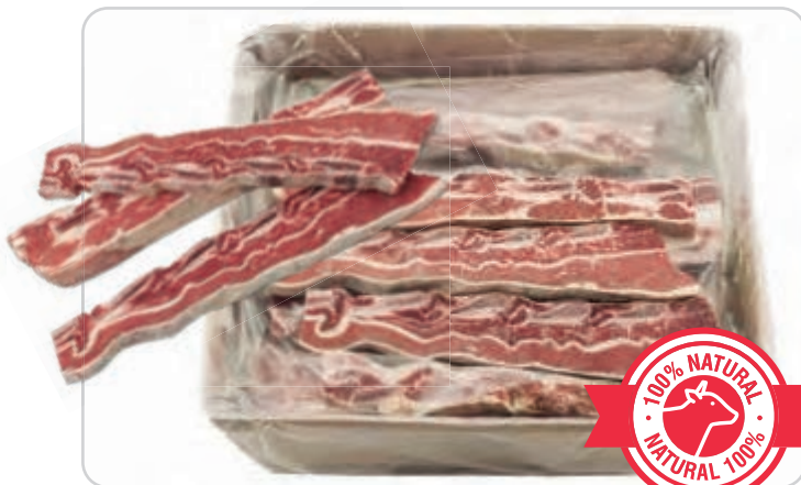
C-5555 CHURRASCO DE TERNERA Caja: 5 kg aprox. La ración de 100 g le sale a 0,57 €

Churrasco de ternera, ideal para hacer a la brasa. Carne de ternera 100%.