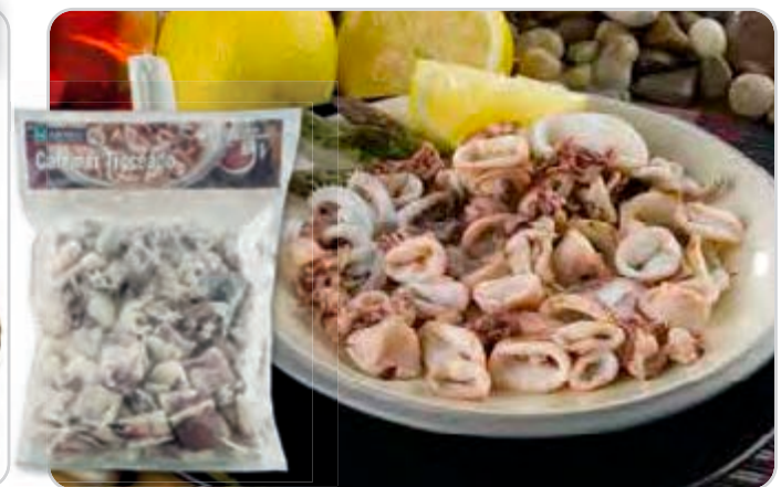
C-1006 CALAMAR CHIPIRÓN TROCEADO