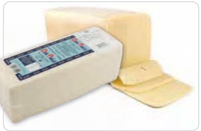
C-4156 QUESO BARRA MANCHEGA (3,2 kg aprox.)