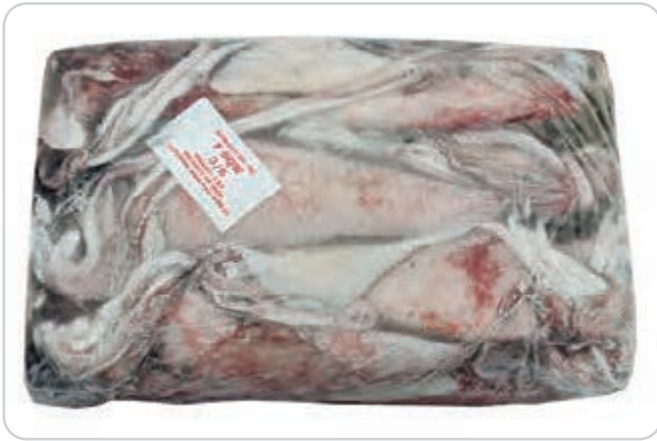
C-5005 CALAMAR ENTERO (INDIA) (3/6 pzas./kg)