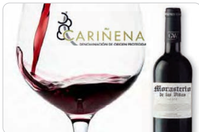
C-6696 VINO TINTO ROBLE MONASTERIO DE LAS VIÑAS Botella 75 cl Caja: 6 Botellas / El litro le sale a 2,60 €

Vino tinto crianza de origen Cariñena. Aromas frutales con fondos tostados y de caramelo. En boca es equilibrado, de taninos suaves, persistente y muy agradable.