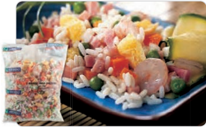
C-6385 ARROZ 6 DELICIAS Bolsa 1 kg