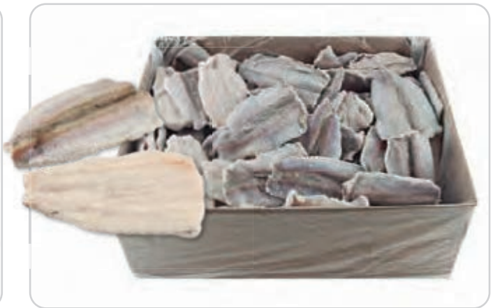
C-3341 FILETES DE BACALADILLA