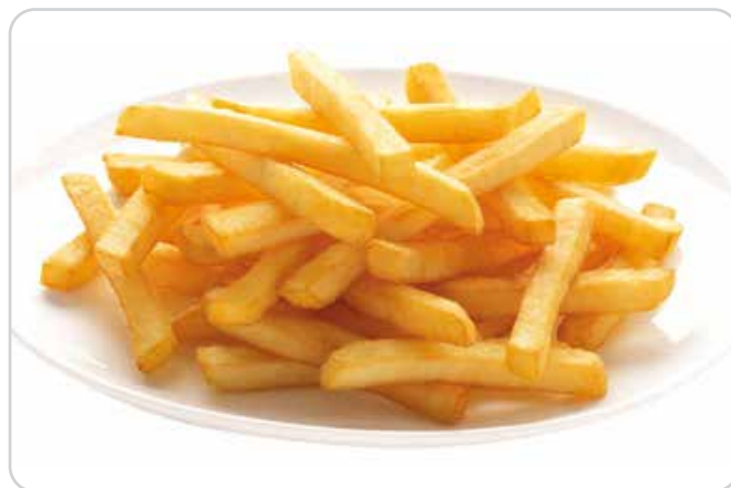
C-6334 PATATAS CORTE GRUESO (10x10) Bolsas 2,5 kg Caja: 4 Bolsas / La bolsa de 2,5 kg le sale a 2,45 € La ración de 100 g le sale a 0,10 €

Patata de la mejor variedad cortadas 10x10. Al igual que el resto de patatas prefritas, se pueden freír directamente sin descongelar.