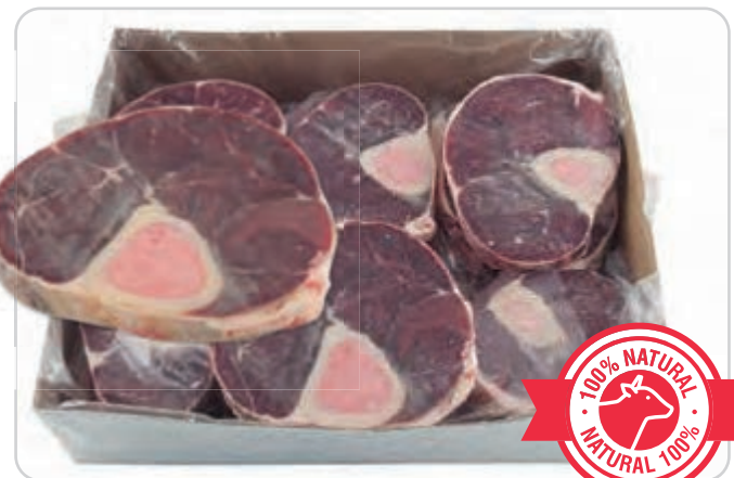
C-5546 OSOBUCO DE TERNERA Caja: 5 kg aprox. La ración de 100 g le sale a 0,47 €

El osobuco es una de las partes más melosa y jugosa de la ternera, ideal para cocinar en salsa y guarnición al gusto. Este producto es ideal para 2º plato de menús y como plato combinado.