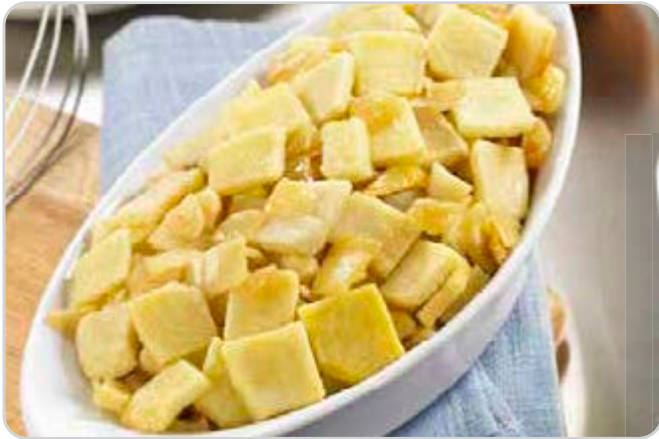
C-6050 MEZCLA PARA TORTILLA DE PATATA FRITA LAMINADA Y CEBOLLA FRITA CUBO Bolsa 1 kg