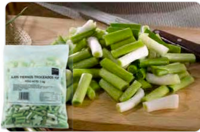
C-3592 AJOS TIERNOS TROCEADOS Bolsa 1 kg

Deliciosas, sanas y nutritivas. Nuestras guarniciones y entrantes son perfectos para la elaboración de platos con los mejores ingredientes para combinar o preparar en un sinfín de menús.