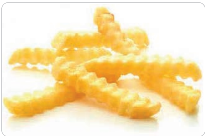
C-395 PATATAS PREMIER CRINKLE Bolsa 1 kg Caja: 10 Bolsas La ración de 100 g le sale a 0,10 €

Patatas de corte ondulado. Prefritas y ultracongeladas. Con corte ondulado para aumentar la textura crujiente.