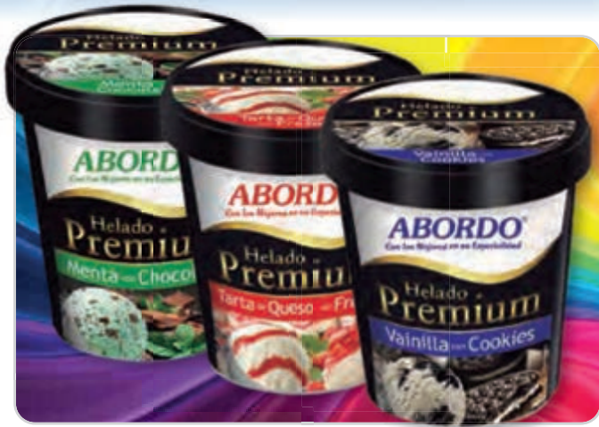
C-831 HELADO DE MENTA CON CHOCOLATE C-832 HELADO DE TARTA DE QUESO Y FRESAS C-833 HELADO DE VAINILLA CON COOKIES Botes 500 ml Caja: 6 Unidades / El litro le sale a 3,98 €

Delicias heladas de crema, producidas artesanalmente.