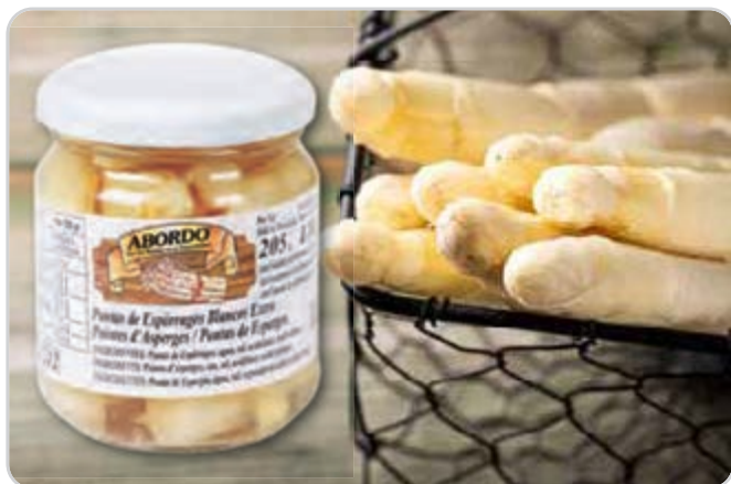
C-9665 PUNTAS DE ESPÁRRAGOS BLANCOS EXTRA Tarro 212 g Caja: 24 Tarros / El kg le sale a 4,72 €

Este vegetal es suave, tierno, exquisito y saludable, con un refrescante sabor y que podemos prepararlo de múltiples maneras rápidamente, sin estar mucho tiempo en la cocina, además de ser una excelente fuente de vitaminas.