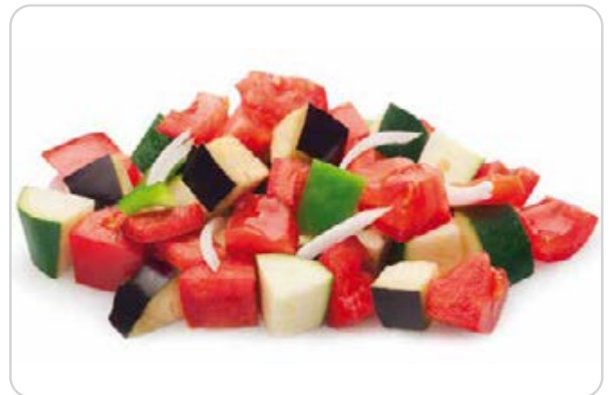
C-8239 PISTO DE VERDURAS Bolsa 1 kg