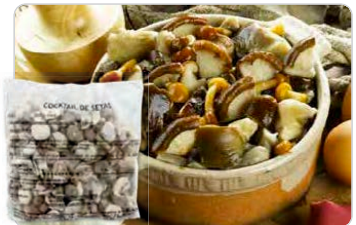
C-6015 SALTEADO MIXTO DE SETAS Bolsa 1 kg