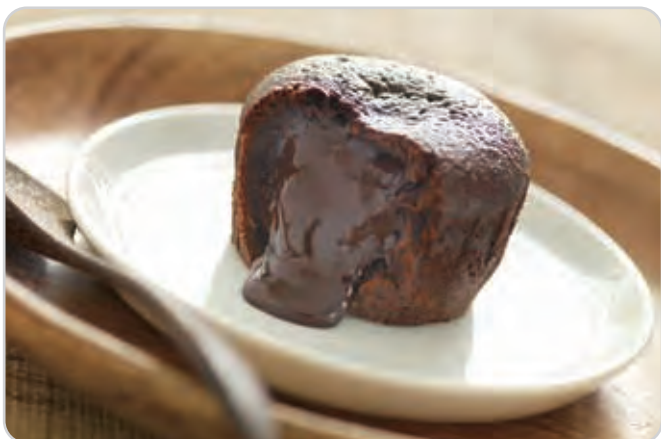
C-2017 COULANT DE CHOCOLATE Caja: 20 Unidades / El kg le sale a 6,90 € La unidad de 100 ml le sale a 0,69 €

Este postre es estilo fondant de chocolate. Se trata de una magdalena de chocolate con chocolate líquido por dentro. Lista en 1 minuto al microondas.