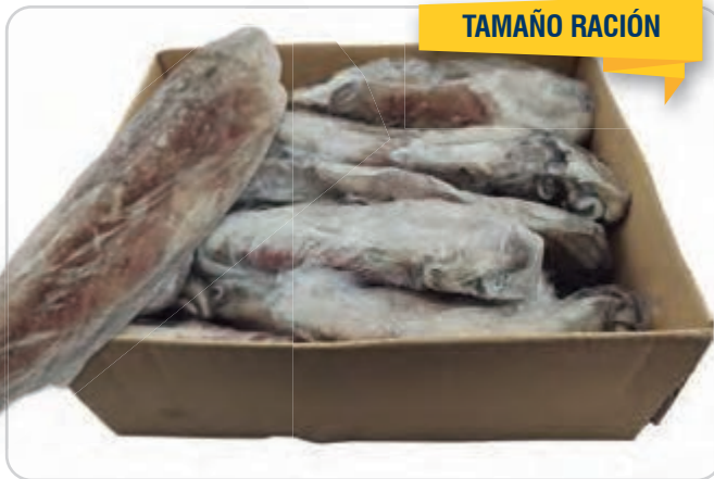
C-7256 CALAMAR (IWP) (MARRUECOS) (P/T) (250/400 g/pza.)