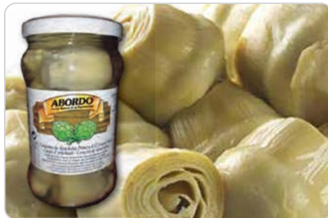
C-9640 ALCACHOFAS ENTERAS (8/12 pzas.) Tarro 314 g Caja: 24 Tarros / El kg le sale a 4,78 €

Estupendos corazones de alcachofas de origen Navarra en aceite de oliva, tiernos y con todo el sabor de los productos de esta tierra.