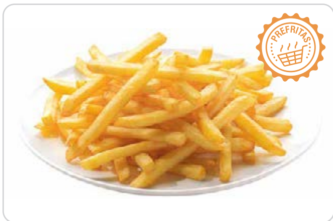
C-6333 PATATAS CORTE FINO (7X7) Bolsa 2,5 kg C-4223 PATATAS PREFRITAS CORTE CASERO Bolsa 2,5 kg Caja: 4 Bolsas / La bolsa de 2,5 kg le sale a 2,65 € La ración de 100 g le sale a 0,11 €

Se trata de unas patatas con corte 7x7 y corte casero irregular de 10x20 mm, prefritas en un 40% del total, válidas para hornear.