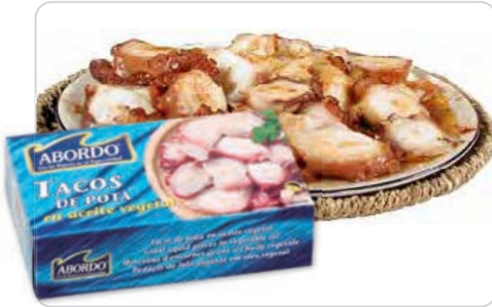
C-9034 TACOS DE POTA EN ACEITE VEGETAL Lata 120 g Caja: 25 Unidades / El kg le sale a 8,56 €

Tacos de pota en aceite vegetal estilo pulpo.