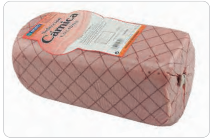
C-4300 BARRA DE YORK PARA SÁNDWICH