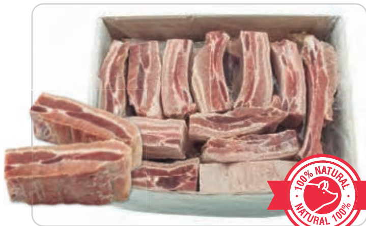
C-4445 COSTILLA DE CERDO CARNUDA