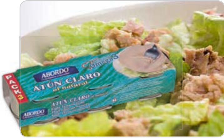
C-10453 ATÚN CLARO AL NATURAL Lata (3 x 80 g) Caja: 32 Unidades / El kg le sale a 6,04 €

Atún claro, 50% tronco, 50% miga, especial ensaladas y bocadillos.