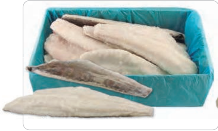
C-1485 FILETES DE BACALAO BLANCO (PUNTO DE SAL) 1ª CALIDAD (+ 1000 g/pza.)