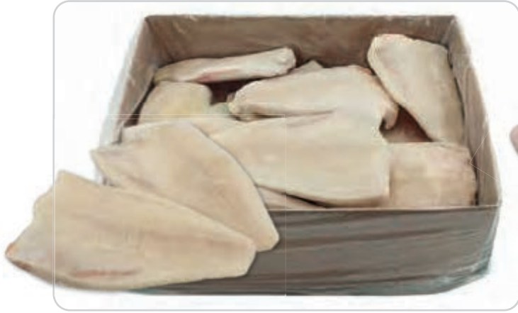
C-3128 LENGUADO LIMPIO (200/350 g/pza.)