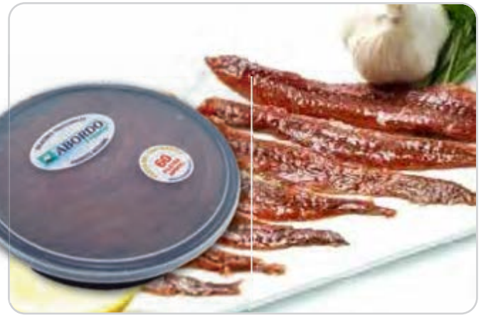
C-4453 FILETES DE ANCHOA Tarrina 360 g