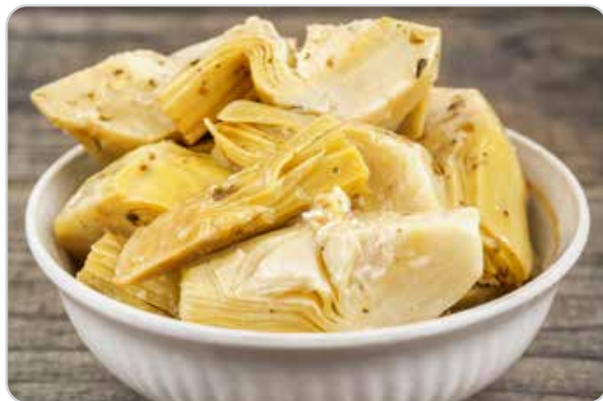
C-6002 ALCACHOFAS CORTADAS Bolsa 2,5 kg

Caja: 4 Bolsas / La bolsa de 2,5 kg le sale a 9,45 €