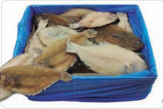
C-3161 LENGUADO (PALAYA) (200/300 g/pza.)