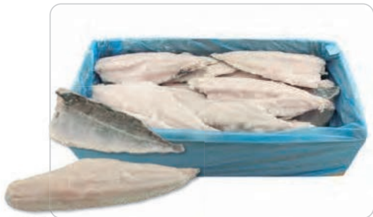
C-3190 FILETES DE BACALAO GRIS (AL PUNTO DE SAL) (500/1000 g/pza.)