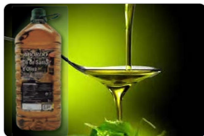
C-9700 OLI DE SANSÀ D'OLIVA Garrafa 5 L Caja: 3 Unidades / El litro le sale a 1,59 €

El aceite de Orujo de Oliva con aceite de Oliva Virgen Extra (Sansa d'Oliva en Valencià) procedente del tratamiento del producto obtenido tras la extracción del aceite de oliva virgen extra 100%.