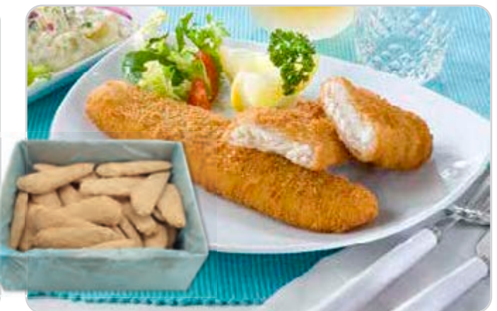
C-122 BACALAO EMPANADO (160/170 g/pza.)

Caja: 50 Unidades / El kg le sale a 7,81 €