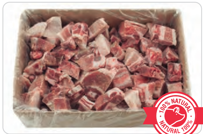
C-2215 COSTILLA DE CERDO TROCEADA