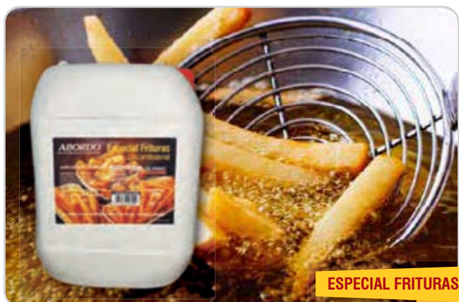
C-9705 ACEITE VEGETAL REFINADO Garrafa 10 L 1 Unidad / El litro le sale a 1,50 €

Aceite especial para freír, vegetal 100%. Fríe sin espumas ni humos ni malos olores a altas temperaturas. De gran estabilidad gracias a su contenido rico en ácido oleico. Máximo rendimiento garantizado, reutilizable numerosas veces sin deteriorarse.