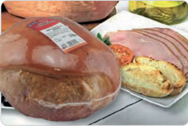
C-4203 PALETA ENTERA LACÓN