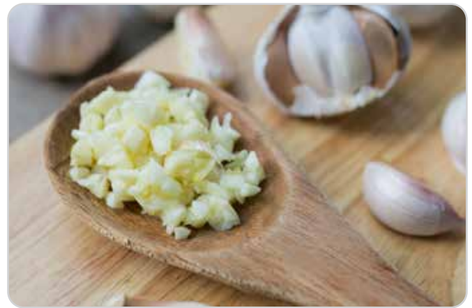
C-705 AJO PICADO Bolsa 125 g

Caja: 16 Bolsas / El kg le sale a 5,60 €