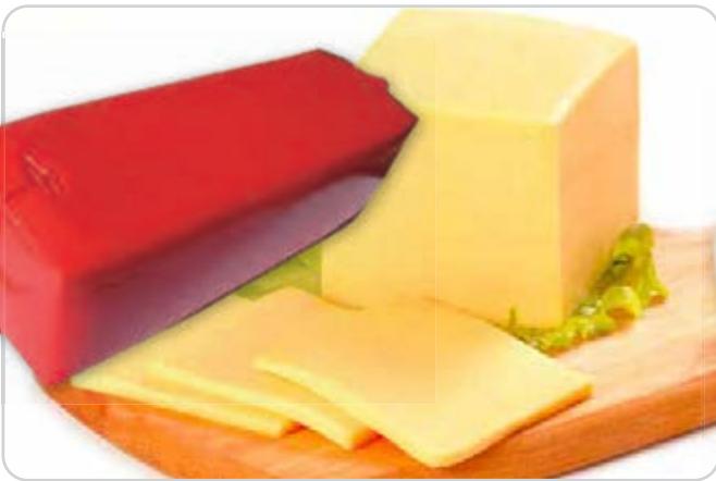
C-4149 BARRA EDAM ALEMANA (3 kg aprox.)