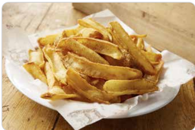
C-6775 PATATAS DIPPER FRIES Bolsa 2,5 kg Caja: 4 Bolsas / La bolsa de 2,5 kg le sale a 3,65 € La ración de 100 g le sale a 0,15 €

Patata cortada tipo teja, rebozada con hierbas, al horno o fritas se convierte en una guarnición muy especial.