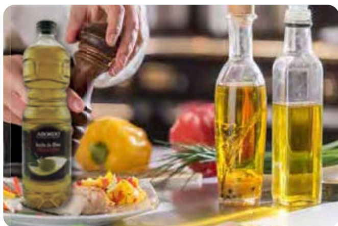
C-9890 ACEITE DE OLIVA VIRGEN EXTRA (AOVE) Botella 1 L Caja: 15 Unidades

Solo con la aceituna picual, en su primer prensado, conseguimos un aceite de oliva 100% virgen extra, con esta calidad y sabor únicos. No está refinado lo que hace que al calentarlo crezca un 20/25 % aprox.