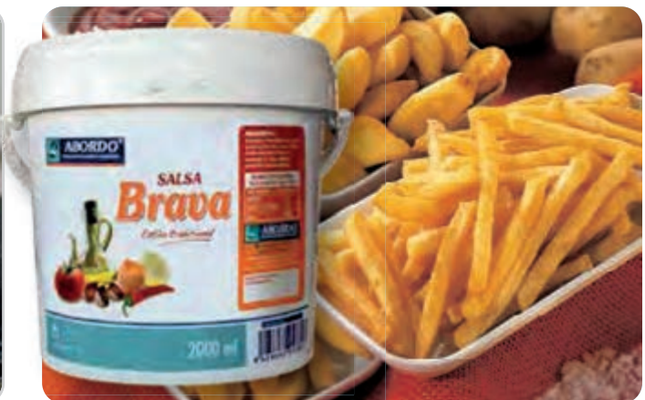
C-9684 SALSA BRAVA Bote 2000 ml