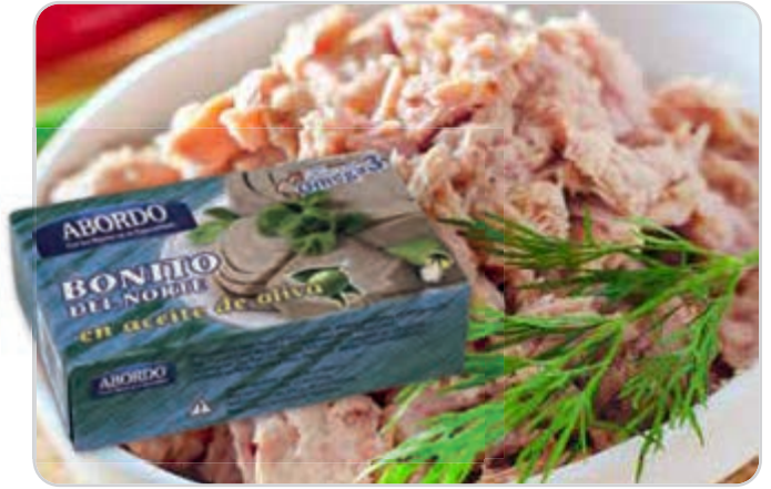
C-10454 BONITO DEL NORTE EN ACEITE DE OLIVA Lata 110 g Caja: 25 Unidades / El kg le sale a 10,45 €

Bonito con aceite de oliva, un producto 100% natural de 1ª calidad.