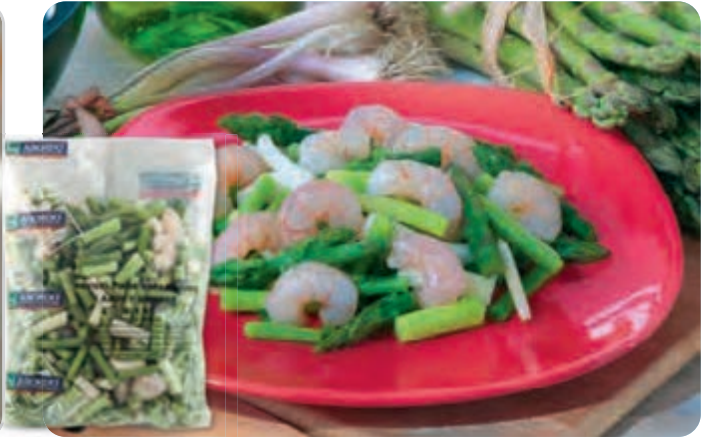
C-6042 REVUELTO DE ESPÁRRAGOS, AJOS Y GAMBAS Bolsa 1 kg