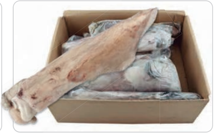
C-7179 CALAMAR (IWP) (MARRUECOS) (GG/T) (1000/1500 g/pza.)