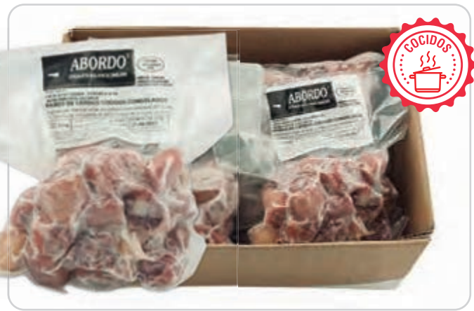
C-4580 RABO DE CERDO COCIDO Bolsa 500 g