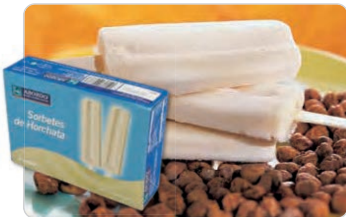
C-776 POLOS DE HORCHATA (Estuche 6 x 60 ml/u) Caja: 8 Estuches / El litro le sale a 4,58 €

Refrescantes polos de horchata Valenciana. Un sabor espectacular!