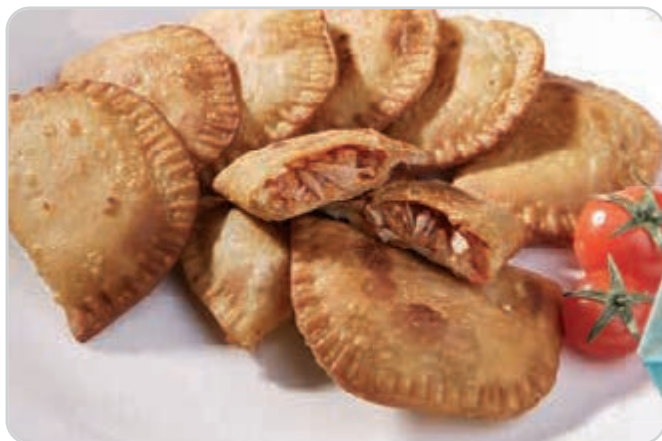
C-6310 EMPANADILLAS DE ATÚN (96 u.)