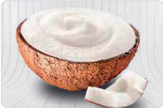
C-4413 COCO RELLENO (160 ml/u) Caja: 24 Unidades

Limón relleno de un delicioso helados de crema, elaborado artesanalmente, sabor limón.