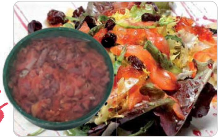
C-4487 ENSALADA DE AHUMADOS Tarrina 500 g

Elaboración artesana de todos nuestros productos.