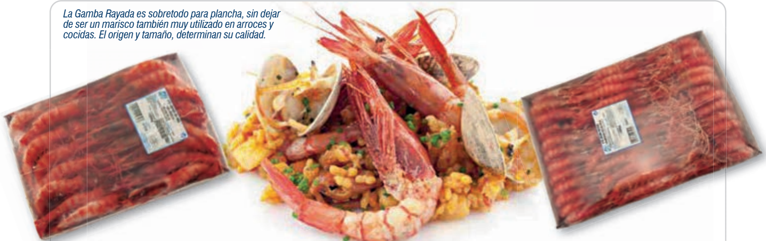
C-611 GAMBAS RAYADAS GIGANTES (ÁFRICA)

La Gamba Rayada es sobretodo para plancha, sin dejar de ser un marisco también muy utilizado en arroces y cocidas. El origen y tamaño, determinan su calidad.