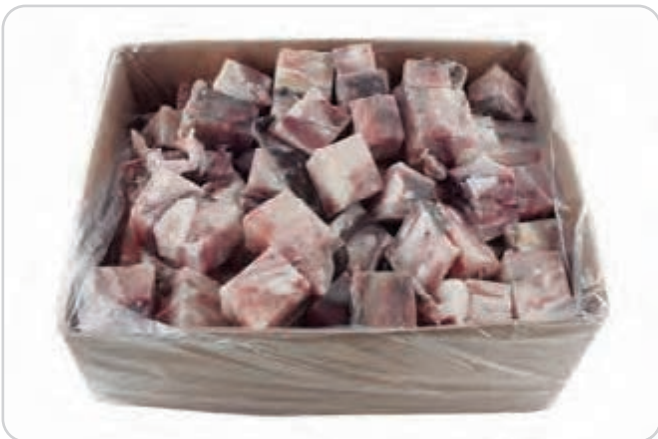
C-3773 CARRILLADA Y CABEZA DE RAPE (TROCEADO)