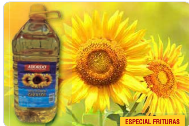
C-14263 ACEITE REFINADO DE GIRASOL Garrafa 5 L Caja: 3 Unidades / El litro le sale a 1,00 €

Aceite 100% girasol. Especial para frituras.