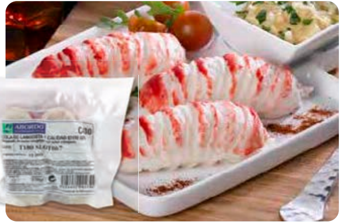
C-430 SUCEDÁNEO DE COLA DE LANGOSTA Bolsa 170 g

Caja: 30 Bolsas / El kg le sale a 7,35 €