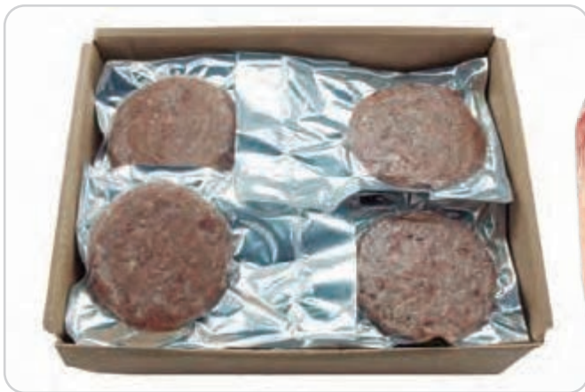
C-499 HAMBURGUESAS EXTRA 100% TERNERA (180 g) Caja: 20 Unidades / El kg le sale a 6,11 €

La carne mantiene la misma calidad si se ultracongela sin necesidad de añadirle ningún conservante. Entre las ventajas de consumir carne congelada destacan la frescura, la seguridad, el mantenimiento del valor nutritivo, la no reproducción de microorganismos, la disponibilidad, la comodidad y su fácil accesibilidad.