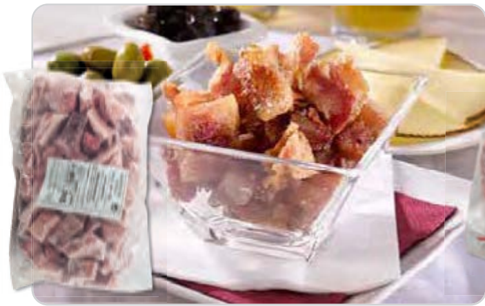
C-565 CARETA DE CERDO TROCEADA Bolsa 1 kg