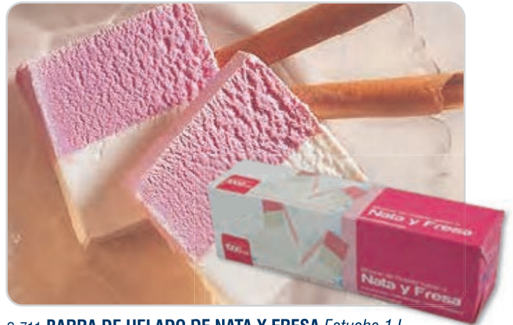
C-711 BARRA DE HELADO DE NATA Y FRESA Estuche 1 L Caja: 6 Estuches La ración de 125 ml le sale a 0,14 €

Barra de helado especial para corte. Sabor nata y fresa.