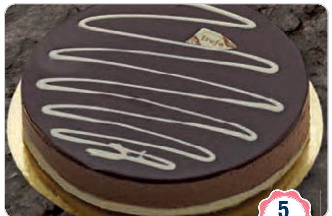
C-882 MOUSSE DE CHOCOLATE (500 g) Caja: 4 Unidades / El kg le sale a 7,90 € La ración de 100 g le sale a 0,79 €