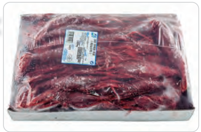
C-3538 CAMARÓN ROJO (PERIQUITOS)