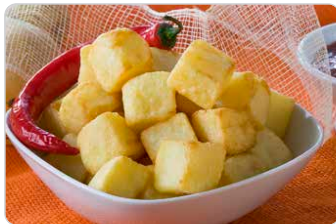
C-304 PATATAS BRAVAS Bolsa 2,5 kg Caja: 4 Bolsas / La bolsa de 2,5 kg le sale a 2,45 € La ración de 100 g le sale a 0,10 €

Cortadas a una medida perfecta para restauración, ya que se frien uniformemente.