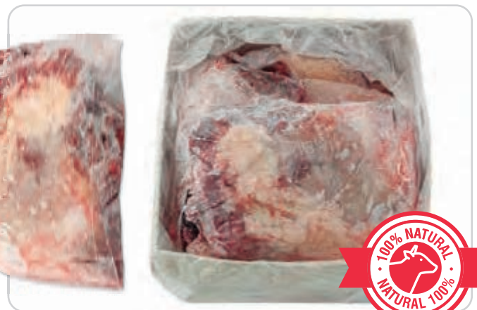
C-1062 CARRILLADA DE TERNERA Caja: 4 kg aprox. La ración de 150 g le sale a 1,30€