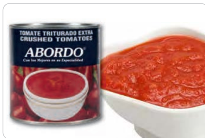
C-9991 TOMATE TRITURADO Bote 5 kg 1 Unidad / El kg le sale a 0,71 €

Tomate maduro, natural y triturado. Listo para cocinar.