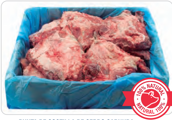
C-4571 PUNTA DE COSTILLA DE CERDO CARNUDA