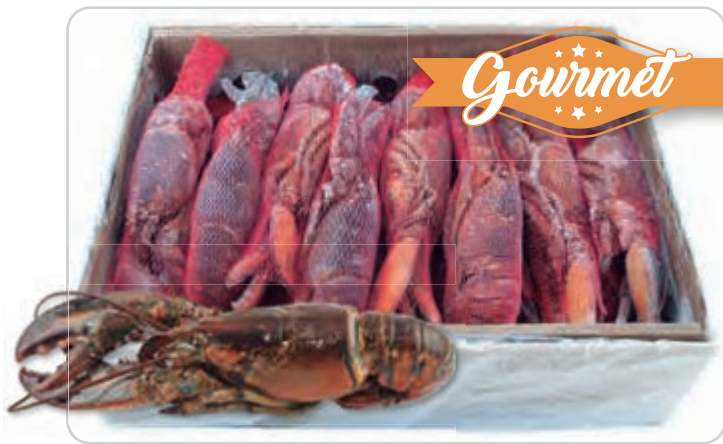
C-7680 BOGAVANTES CRUDOS (300/400 g/pza.)

Los mariscos congelados suponen una mayor comodidad ya que son fáciles de almacenar y vienen preparados para ser cocinados directamente sin que se tengan que lavar o limpiar.