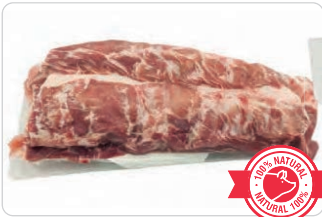
C-6013 PLUMA DE CERDO (1 kg aprox.)