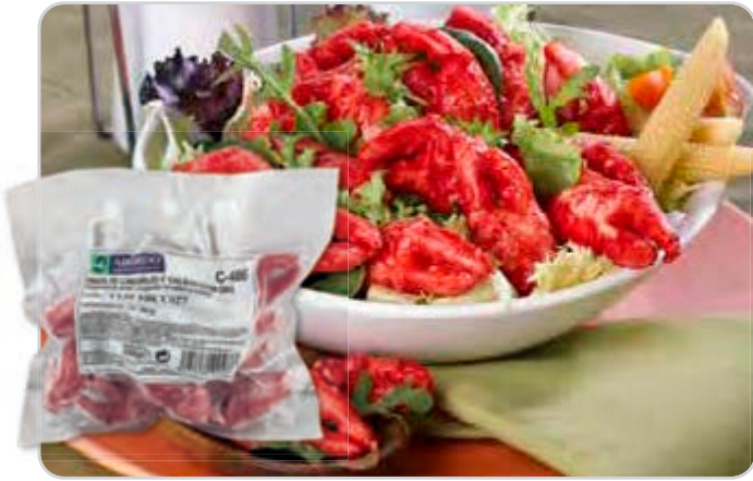
C-486 SUCEDÁNEO DE PINZAS DE CANGREJO Bolsa 150 g

Caja: 20 Bolsas / El kg le sale a 8,33 €