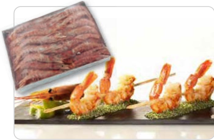
C-617 GAMBÓN GRANDE (T) (30/40 pzas./kg) Estuche 2 kg