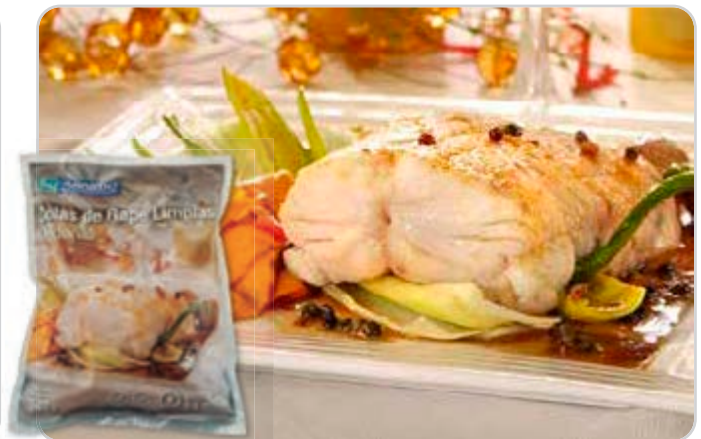
C-3653 RAPE MEDIANO LIMPIO (150/300 g/pza.)