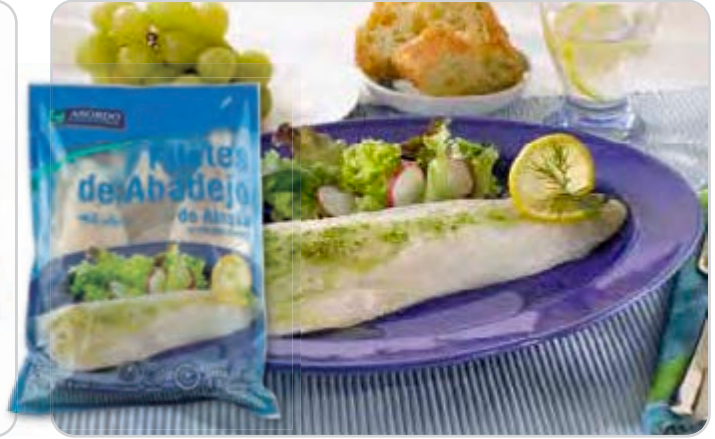
C-4648 FILETES DE ABADEJO (SIN PIEL) (4/8 pzas.)