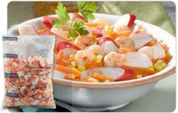
C-6393 ENSALADA CON GAMBAS Bolsa 1 kg