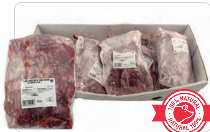
C-5050 CARRILLADA INTERNA DE CERDO (SIN HUESO)