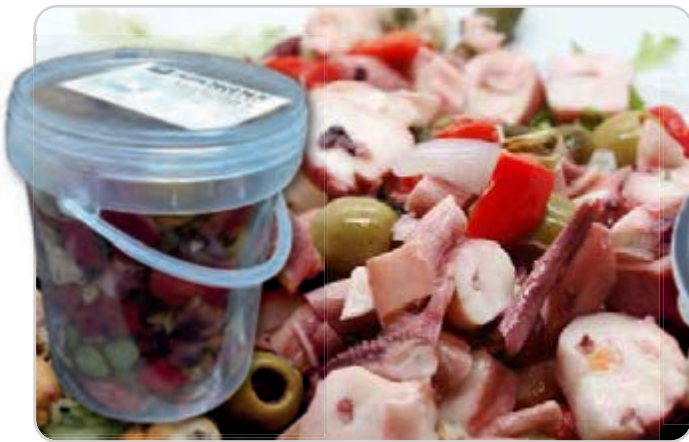
C-4551 SALPICÓN CUBO (1,4 kg)