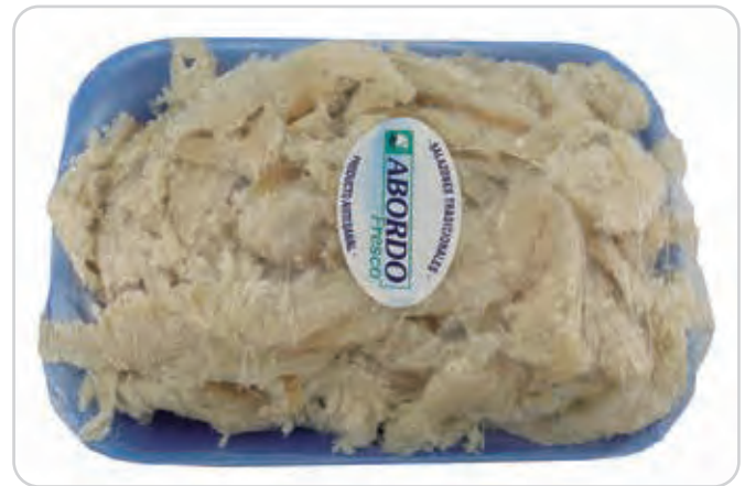
C-4461 MIGAS DE BACALAO Bandeja 1 kg