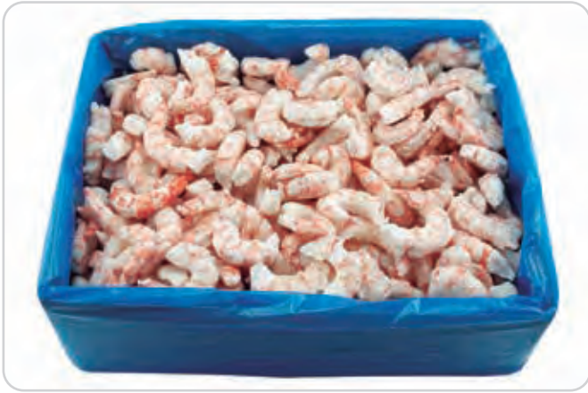
C-3471 COLAS DE GAMBÓN (SIN PIEL Y DESVENADOS) (30/60 pzas./kg)