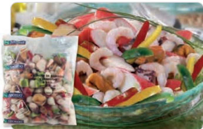
C-6103 SALPICÓN DE MARISCOS Y VERDURAS Bolsa 800 g