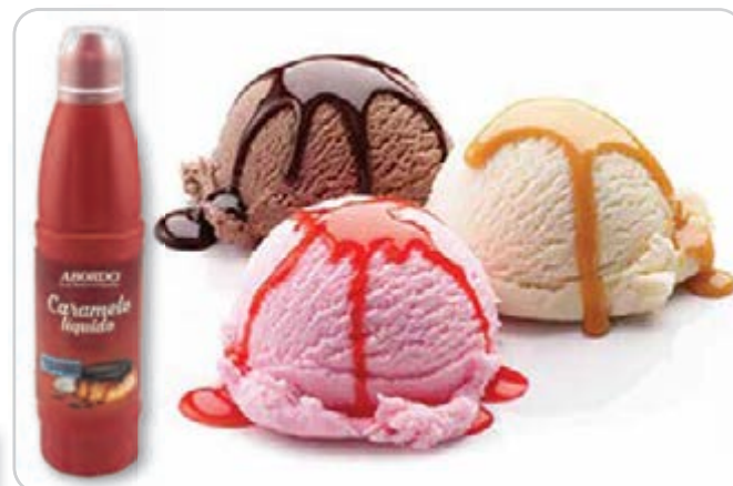
C-9321 SIROPE DE CARAMELO Botella 900 ml 1 Unidad / El litro le sale a 2,61 €

La mejor combinación de sabor y textura de la forma más tradicional, con nuestra receta casera, hemos logrado el mejor condimento para disfrutar en infinidad de platos: gofres, tartas, cupcakes, tortitas, bizcochos, fresas, galletas, helados, bollos