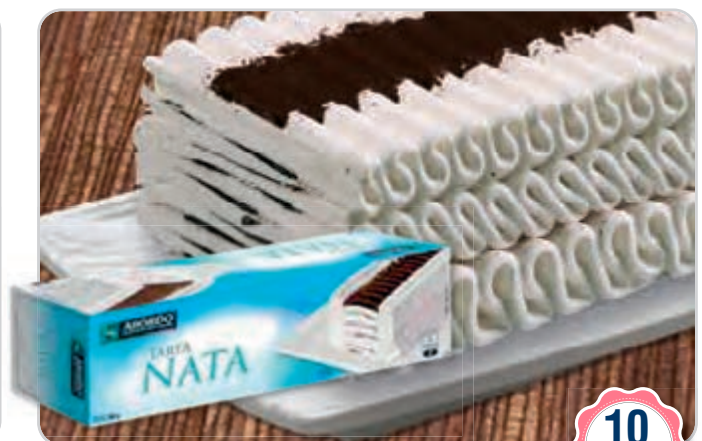
C-936 TARTA LAMINADA DE NATA Y CHOCOLATE (10 raciones) Estuche 1 L

Caja: 4 Estuches La ración de 125 ml le sale a 0,20 €