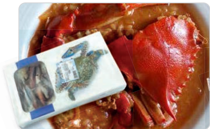
C-2654 CANGREJO AZUL (PARTIDO) Estuche 1 kg