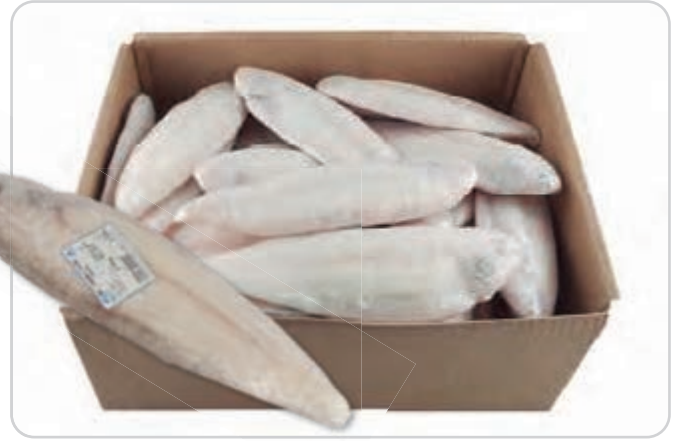
C-1027 LENGUADO GRANDE PELADO (150/200 g/pza.)