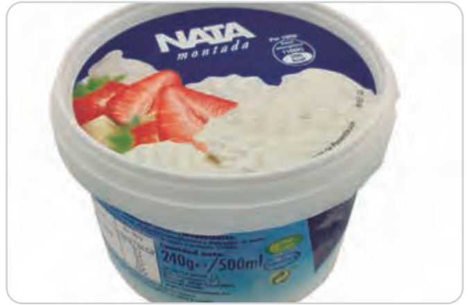
C-706 NATA MONTADA Tarrina 500 ml Caja: 12 Tarrinas / El litro le sale a 2,30 € La ración de 125 ml le sale a 0,29 €

Nata montada helada de primera calidad, es el acompañamiento ideal para fresas y postres.