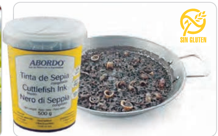
C-1210 TINTA DE SEPIA (Bote 500 g)