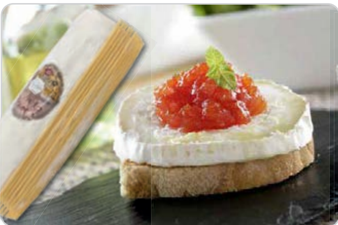
C-4151 RULO DE CABRA (1 kg)