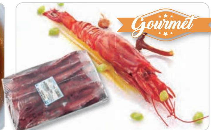
C-676 ROJOS BRILLANTES MEDIANOS (ÁFRICA) (16/20 pzas./kg)