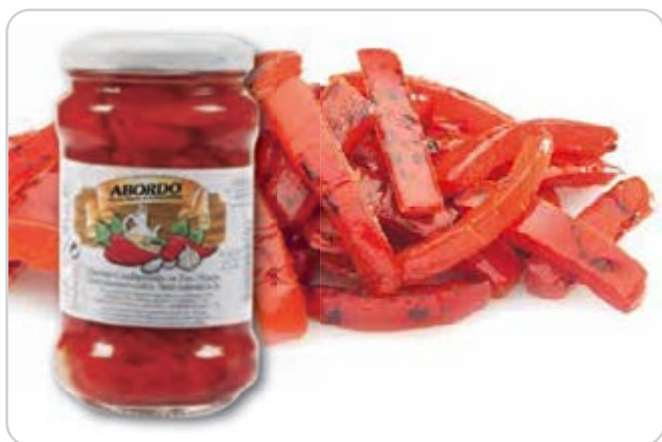
C-9546 PIMIENTO MORRÓN A TIRAS Tarro 314 g Caja: 24 Tarros / El kg le sale a 2,87 €

Pimiento morrón, asado y en conserva. Especial ensaladas.