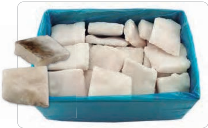
C-796 BACALAO BLANCO TROCEADO (PUNTO DE SAL) (SIN ESPINAS)