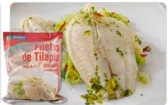
C-1256 FILETES DE TILAPIA (100/140 g/pza.) Bolsa 640 g (netos sin glaseado)