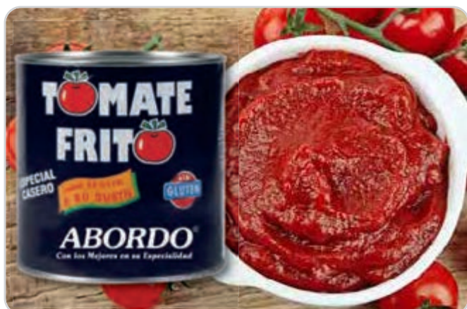
C-9757 TOMATE FRITO Bote 2650 g 1 Unidad / El kg le sale a 0,85 €

Tomate limpio de piel de primera calidad, elaborado a fuego lento con aceite de oliva, sal y azúcar