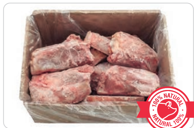
C-5029 CODILLO DE CERDO PARTIDO (A MITADES)