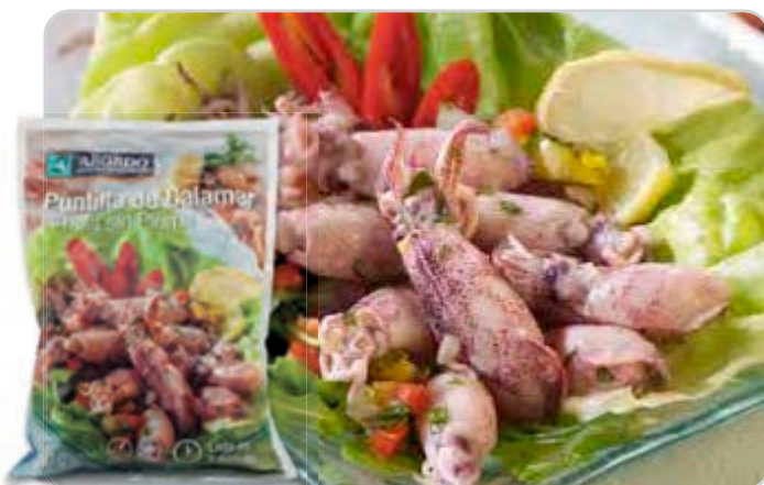
C-1007 PUNTILLAS DE CALAMAR (SIN PLUMA) (JAPONICA)