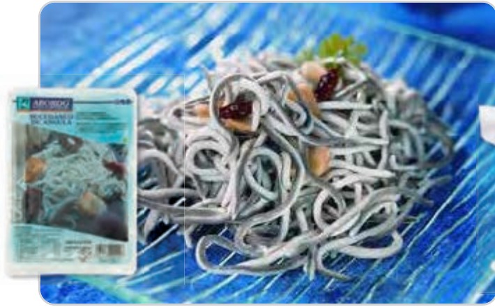
C-400 SUCEDÁNEO DE ANGULAS Estuche 200 g

Caja: 20 Estuches / El kg le sale a 7,95 €