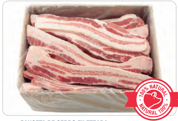
C-4389 PANCETA DE CERDO FILETEADA