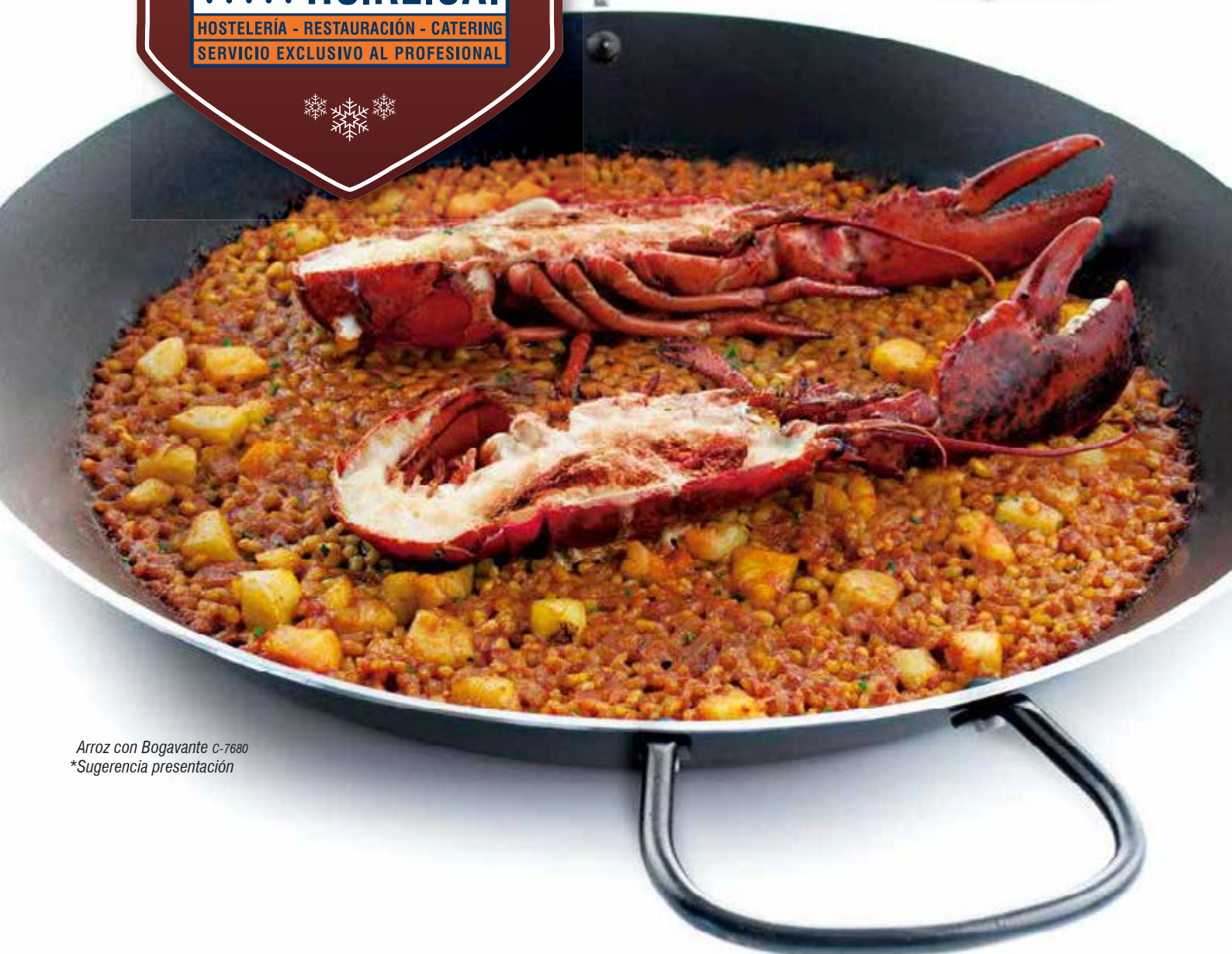
Arroz con Bogavante c-7680 *Sugerencia presentación

Nuestro trabajo es hacer que el suyo resulte excelente