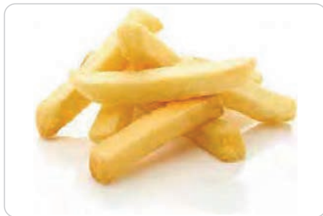
C-192 PATATAS WAY COOK (AL HORNO) (10X10) Bolsa 750 g Caja: 12 Bolsas / El kg le sale a 1,07 € La ración de 100 g le sale a 0,11 €