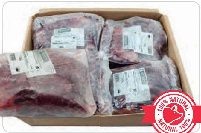
C-3586 CARRILLADA EXTERNA DE CERDO (SIN HUESO)