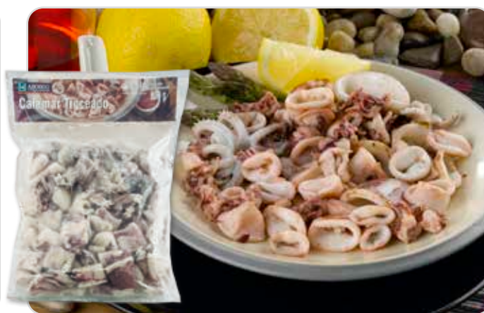
C-1006 CALAMAR CHIPIRÓN TROCEADO Bolsa 800 g (netos sin glaseado)

Caja: 5 Bolsas / El kg le sale a 7,43 € neto