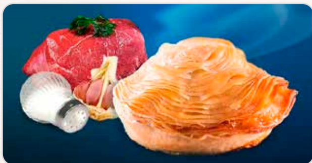
C-593 MASA QUEBRADA Envase 500 g Caja: 8 Unidades / El kg le sale a 3,00 €

Masa de hojaldre quebrada, especial para repostería.