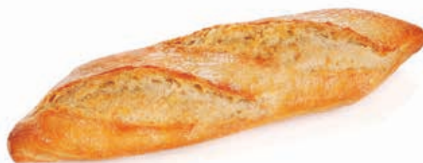
C-2854 PAYESA DE CEREALES (300 g) Caja: 29 Unidades / El kg le sale a 1,63 €

Para hornear, descongelar durante 30 min y cocer 15 min en horno precalentado a 180°.