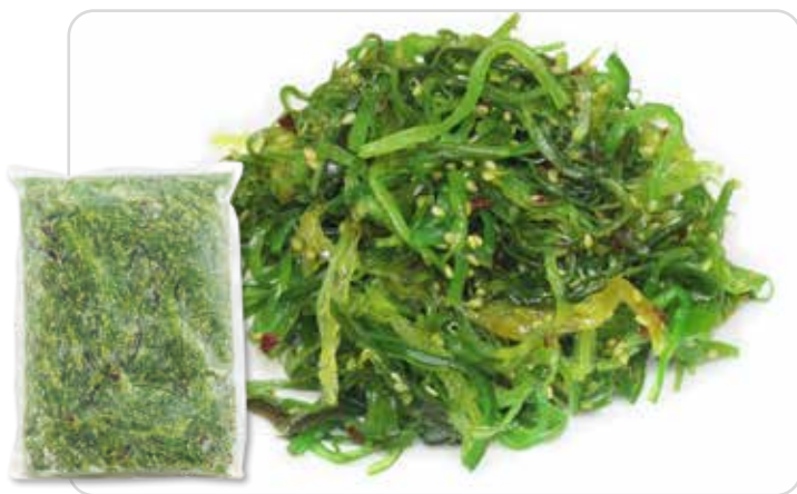
C-592 WAKAME Bolsa 1 kg