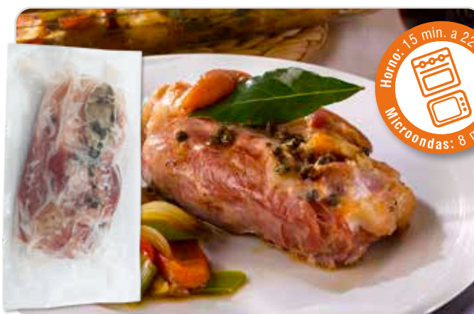
C-6140 CODILLO DE CERDO (COCIDO) Bolsa 400 g Caja: 8 Bolsas / El kg le sale a 6,50 € La ración de 400 g le sale a 2,60 €

1/2 Codillo de cerdo cocido y envasado al vacío. Se puede consumir solo o añadiéndole una guarnición de verduras, puré de patatas, tomate frito, etc.