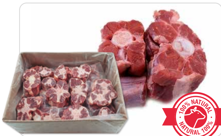
C-5051 RABO DE TERNERA CORTADO