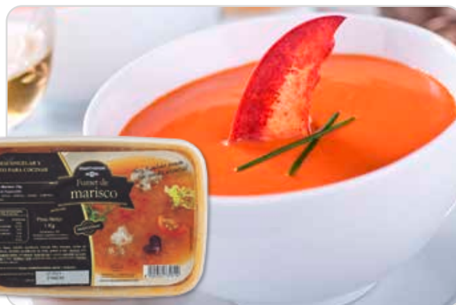
C-7228 FUMET DE MARISCO Bol 1 L Caja: 4 Boles La ración de 100 ml le sale a 0,50 €

El fumet de marisco es una base deliciosa para cualquier plato de marisco. Se puede emplear para arroces, sopas, fideuá, salsas... para darle el toque a cualquier receta.