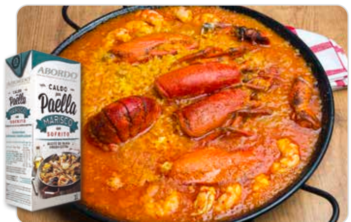
C-4607 CALDO PARA PAELLA CON SOFRITO Brick 1 L Caja: 12 Bricks

El Caldo con sofrito te permite preparar con gran facilidad una paella, ya que ahorra la elaboración tanto del sofrito como del caldo. Incluye el caldo gambas, pescado y aceite de oliva y por otro el sofrito con hortalizas seleccionadas.