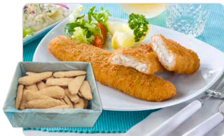
C-122 BACALAO EMPANADO (140/160 g/pza.)

Caja: 50 Unidades / El kg le sale a 7,81 €