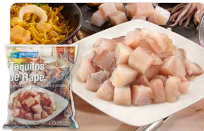
C-3201 TAQUITOS DE RAPE (2X2)