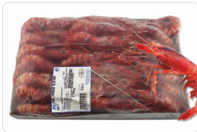
C-4368 CAMARÓN ALISTADO