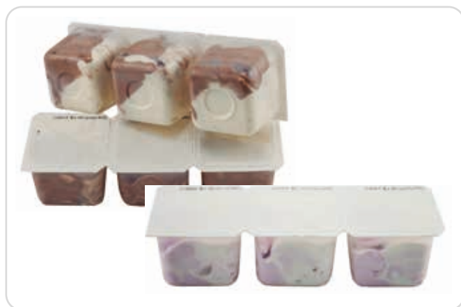
C-7646 VASITOS DE VAINILLA Y CHOCOLATE (3 x 75 ml) C-7647 VASITOS DE NATA Y FRESA (3 x 75 ml) Caja: 25 Unidades / El litro le sale a 1,73 € La unidad de 75 ml le sale a 0,13 €