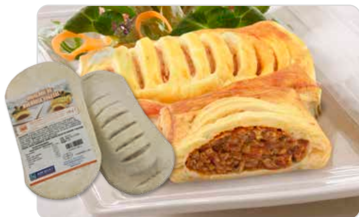
C-144 HOJALDRE BOLONESA VERDURAS (140 g) C-115 HOJALDRE CON SALMÓN Y ESPINACAS (140 g) Caja: 40 Unidades / El kg le sale a 10,71 € La ración de 140 g le sale a 1,50 €

Deliciosos hojaldres rellenos de sabrosas combinaciones de productos de 1ª calidad.