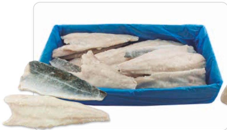
C-2190 FILETES DE BACALAO GRIS (250/500 g/pza.)