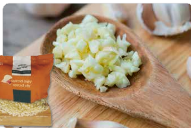
C-705 AJO PICADO Bolsa 125 g

Caja: 16 Bolsas / El kg le sale a 5,60 €