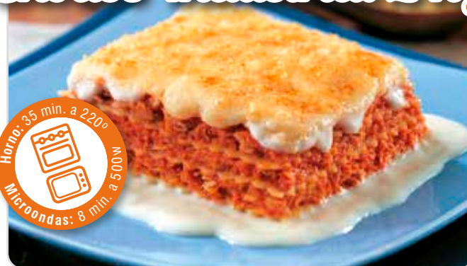
C-330 LASAÑA DE ATÚN CON BECHAMEL Estuche 2 kg Caja: 3 Estuches / El kg le sale a 3,88 € La ración de 300 g le sale a 1,16 €

Lasaña al más puro estilo italiano, atún, pasta de trigo duro y una magnífica bechamel.