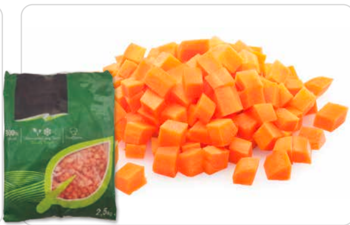
C-6062 ZANAHORIA A DADOS Bolsa 2,5 kg

Solos o combinados con un sin fin de alimentos, son deliciosos y muy saludables.