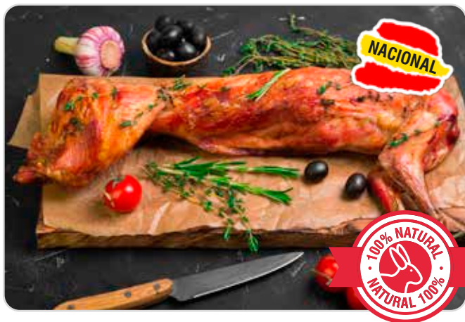
C-5530 CONEJO LIMPIO NACIONAL (800/1000 g/pza. aprox.)