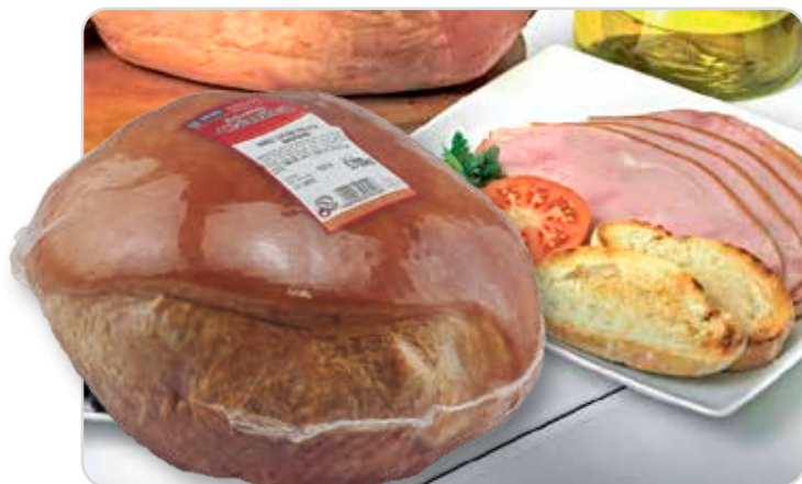
C-4203 PALETA ENTERA LACÓN