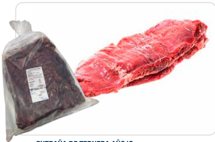
C-5521 ENTRAÑA DE TERNERA AÑOJO