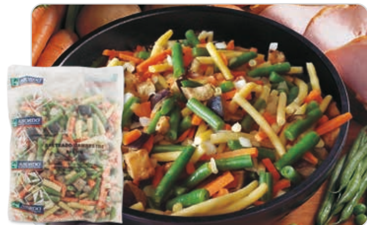
C-7155 SALTEADO CAMPESTRE Bolsa 1 kg