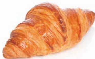
C-2014 CROISSANT DE MANTEQUILLA (60 g) Caja: 80 Unidades / El kg le sale a 4,50 €

Producto para hornear. Descongelar 30 min. Cocer en horno alrededor de 15 min. No es necesario pintar el producto.