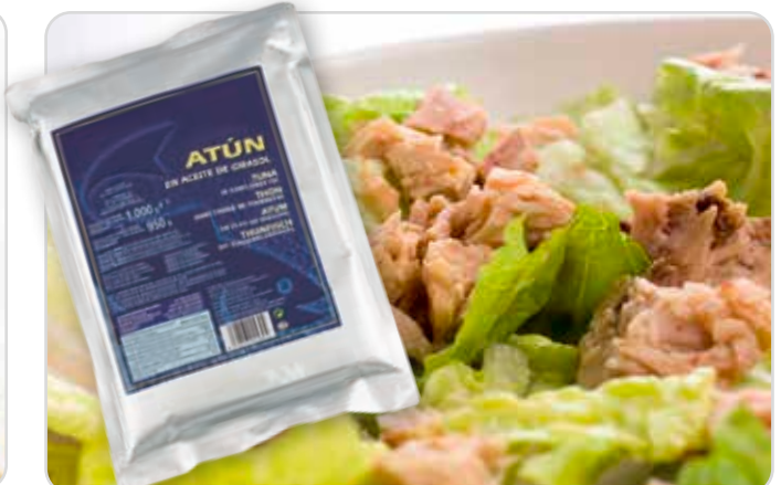
C-4599 ATÚN TRONCO Bolsa 900 g 1 Unidad / El kg le sale a 4,68 €

Se trata de una bolsa de atún con aceite vegetal y sal prácticamente sin merma. Ideal para ensaladas, pizzas, bocadillos, etc.