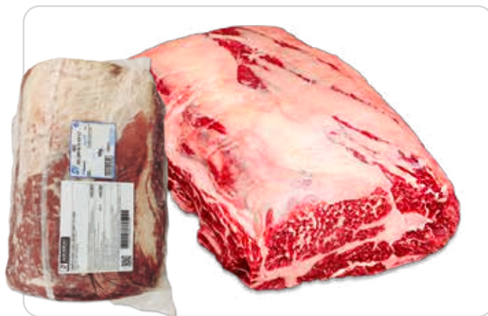
C-4650 LOMO ALTO DE AÑOJO CON TAPA