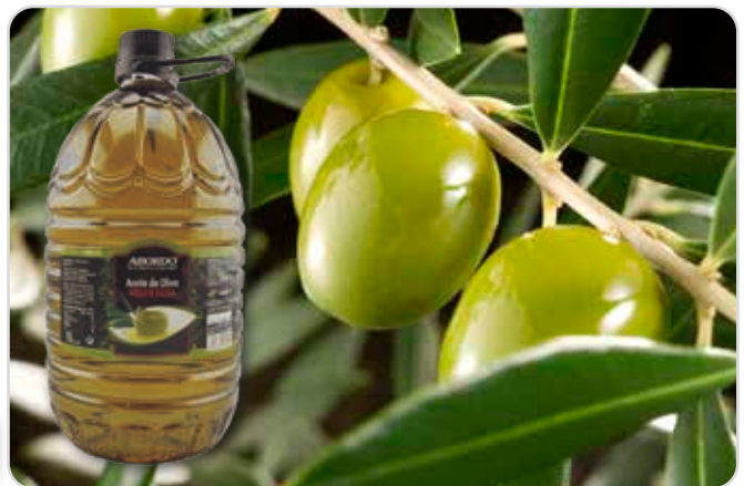
C-9892 ACEITE DE OLIVA VIRGEN EXTRA (AOVE) Garrafa 5 L Caja: 3 Unidades / El litro le sale a 2,90 €

Solo con la aceituna picual, en su primer prensado, conseguimos un aceite de oliva 100% virgen extra, con esta calidad y sabor únicos. No esta refinado lo que hace que al calentarlo crezca un 20/25 % aprox.