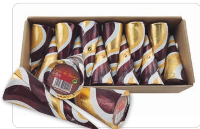
C-968 CONOS DE TURRÓN (120 ml/u) Caja: 24 Unidades / El litro le sale a 3,25 €

En Abordo pensamos que el sabor comienza por la calidad, esta es la principal premisa en la elaboración y selección de todos nuestros productos.