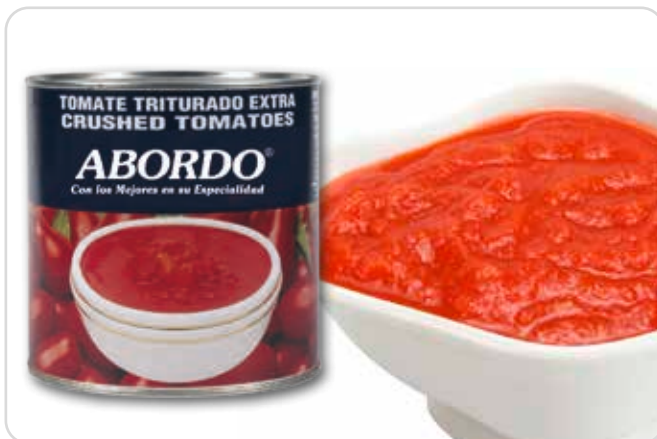
C-9991 TOMATE TRITURADO Bote 5 kg 1 Unidad / El kg le sale a 0,69 €