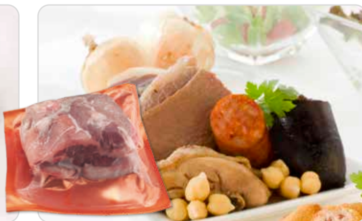
C-5536 ARREGLO DE PUCHERO Bolsa 800 g