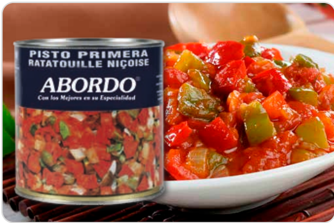
C-9314 PISTO (3 kg) Caja: 6 Unidades / El kg le sale a 1,18 €