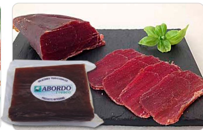
C-4459 MOJAMA DE ATÚN ESPECIAL PRIMERA (1 kg aprox.)