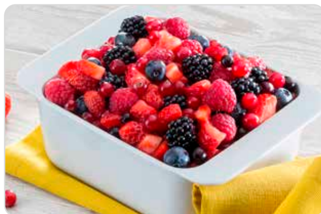
C-784 MEZCLA DE FRUTOS DEL BOSQUE Bolsa 300 g

Caja: 20 Bolsas / El kg le sale a 4,83 €