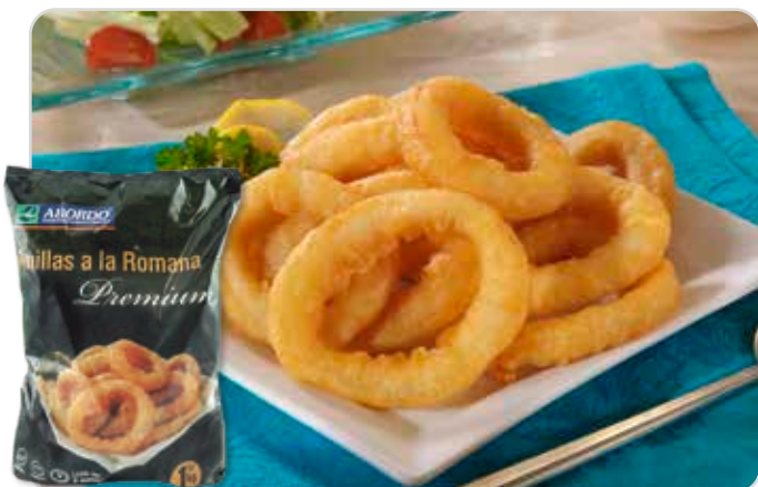
C-435 CALAMAR FINO CASERO PREMIUM Bolsa 1 kg