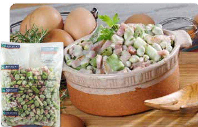
C-7021 SALTEADO DE HABAS, AJETES Y BACÓN Bolsa 1 kg