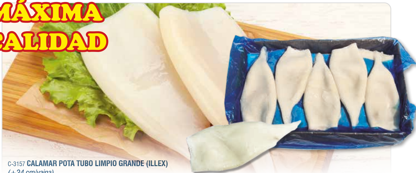
C-3157 CALAMAR POTA TUBO LIMPIO GRANDE (ILLEX) (+24 cm/vaina)