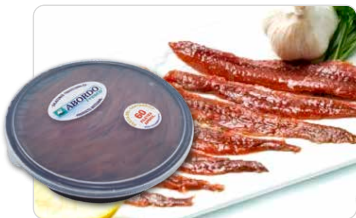
C-4453 FILETES DE ANCHOA Tarrina 360 g