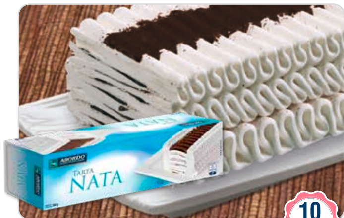
C-936 TARTA LAMINADA DE NATA Y CHOCOLATE (10 raciones) Estuche 1 L