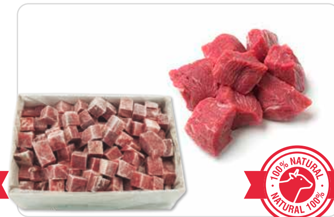
C-6398 TERNERA A TACOS PARA GUIJAR