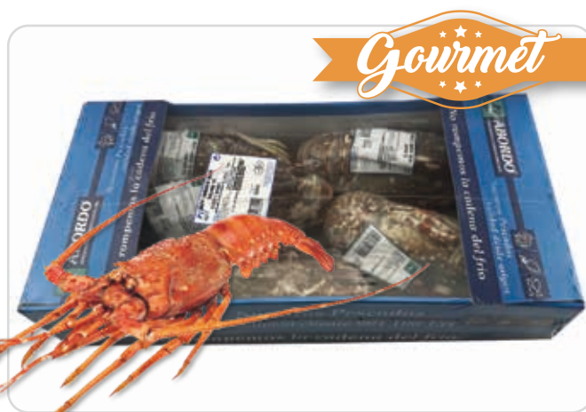
C-3624 LANGOSTA ROJA MEDIANA CRUDA (200/400 g/pza.)

Caja: 5 Unidades / El kg le sale a 22,14 € aprox.