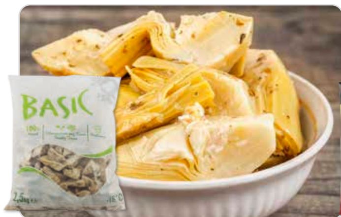
C-6002 ALCACHOFAS CORTADAS Bolsa 2,5 kg

1 Bolsa / La bolsa de 2,5 kg le sale a 9,45 €