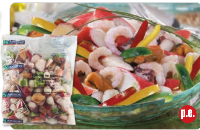
C-6103 SALPICÓN DE MARISCOS Y VERDURAS Bolsa 800 g