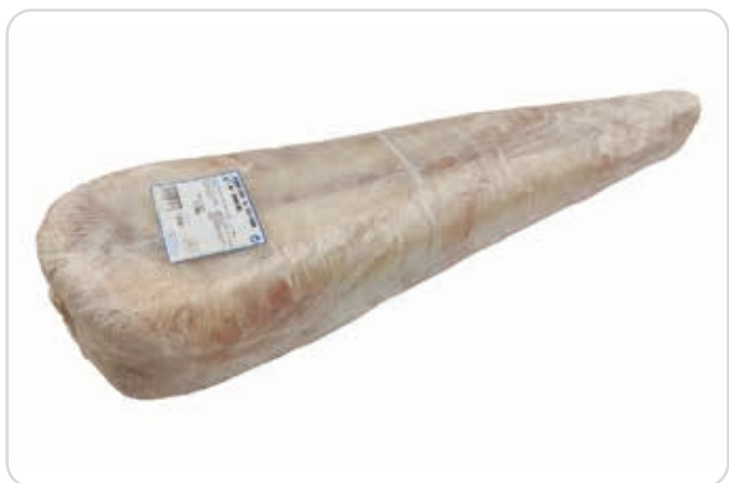
C-3200 COLAS DE RAPE GRANDE (GRAN SOL) (+2000 g/pza.)