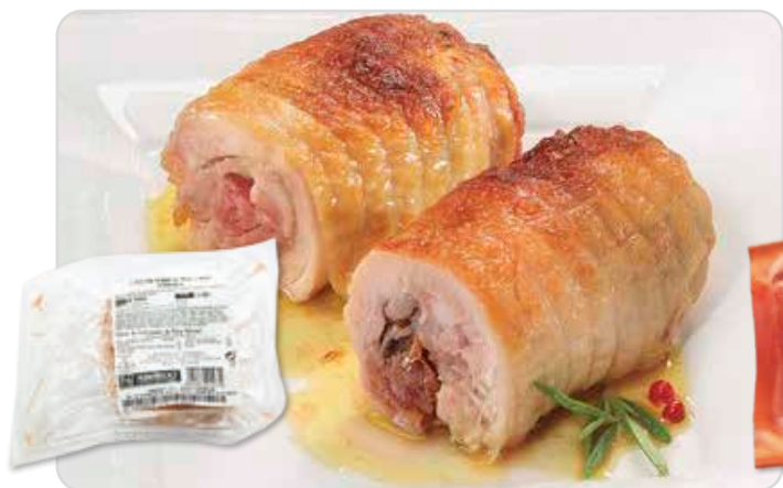
C-1538 MINI REDONDO DE JAMÓN DE POLLO Y PIÑA (2 u.) Bolsa 360 g