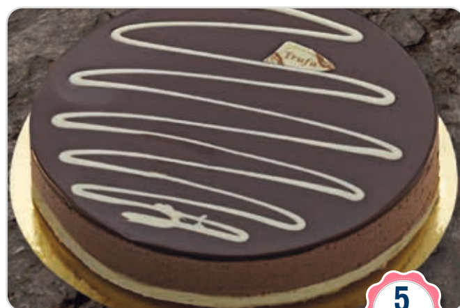
C-882 MOUSSE DE CHOCOLATE (500 g)

Caja: 4 Unidades / El kg le sale a 7,90 €