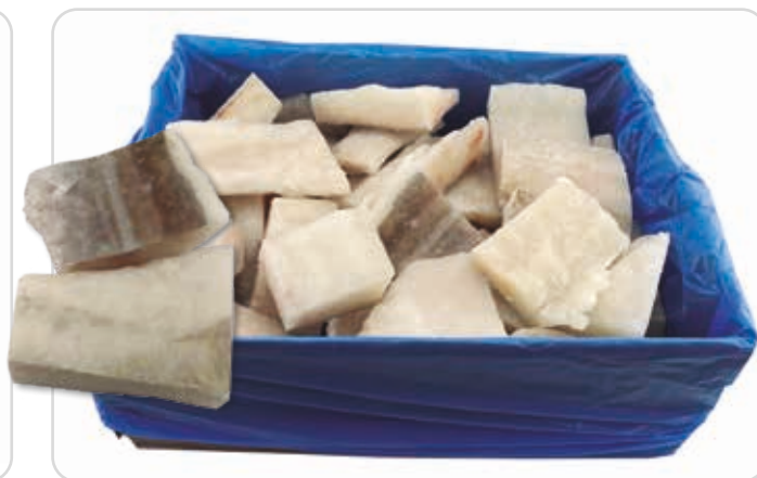
C-796 BACALAO BLANCO TROCEADO (PUNTO DE SAL) (SIN ESPINAS)