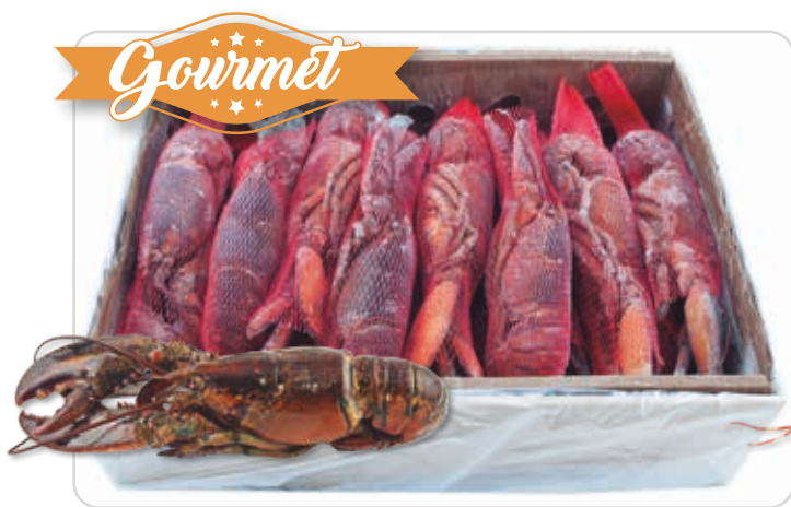
C-7680 BOGAVANTES CRUDOS (300/400 g/pza.)

Los mariscos congelados suponen una mayor comodidad ya que son fáciles de almacenar y vienen preparados para ser cocinados directamente sin que se tengan que lavar o limpiar.