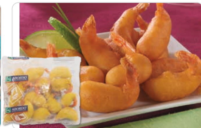
C-313 COLAS DE GAMBAS REBOZADAS Bolsa 300 g

Caja: 15 Bolsas / El kg le sale a 9,67 €