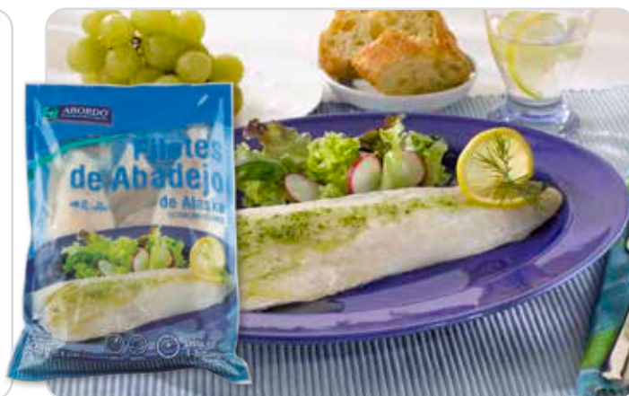
C-4648 FILETES DE ABADEJO (SIN PIEL) (4/8 pzas.)