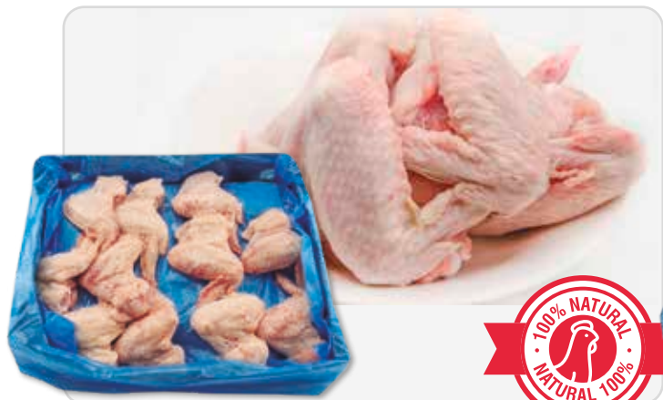
C-5034 ALAS DE POLLO GRADO A LAMINADO (100/125 g/pza.)