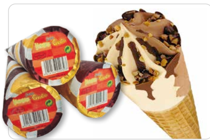
C-876 CONOS DE VAINILLA Y CHOCOLATE (120 ml/u) Caja: 24 Unidades / El litro le sale a 3,00 €

Conos de turrón con un sabor excelente. (Para venta por unidad).