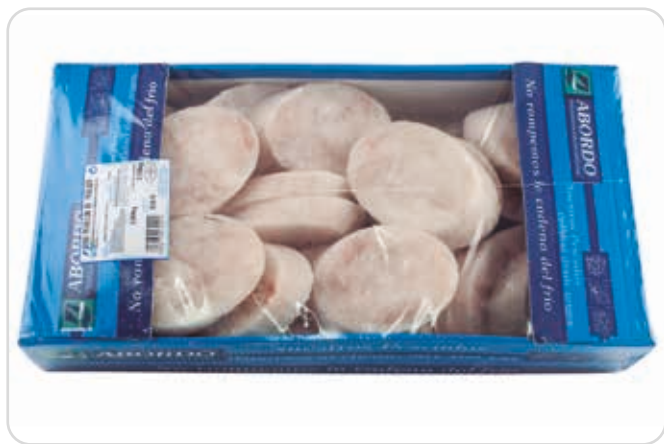
C-8130 MEDALLONES DE MERLUZA