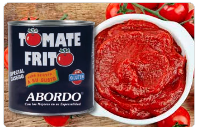
C-9757 TOMATE FRITO Bote 2650 g 1 Unidad / El kg le sale a 0,85 €

Tomate maduro, natural y triturado. Listo para cocinar.