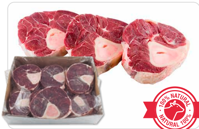
C-5546 OSOBUCO DE TERNERA