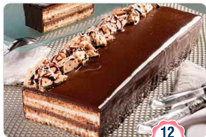
C-838 TARTA DE LA ABUELA (1,5 kg)