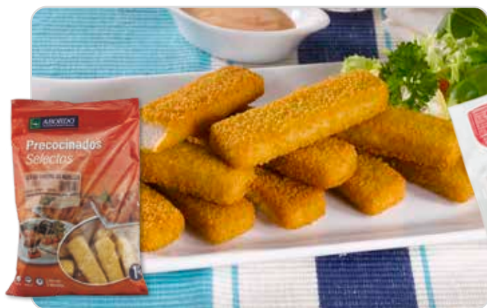
C-6152 VARITAS DE MERLUZA EMPANADAS Bolsa 1 kg