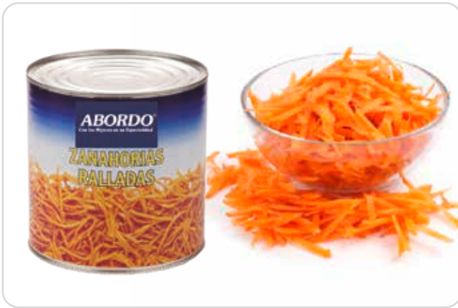
C-9993 ZANAHORIA RAYADA Lata 3 kg Caja: 3 Latas / El kg le sale a 0,57 €