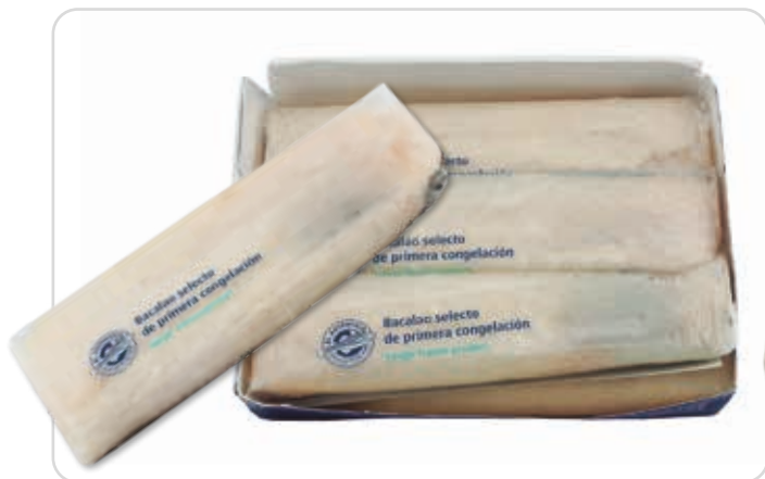
C-795 LOMOS DE BACALAO (+300 g/pza.) (4/6 pzas./caja)