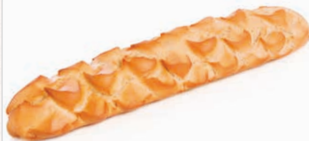
C-4508 BARRA FABIOLA PICOS (275 g) Caja: 23 Unidades / El kg le sale a 2,00 €

Pan estilo gallego precocido y ultracongelado, muy práctico, un valor añadido para sus clientes.