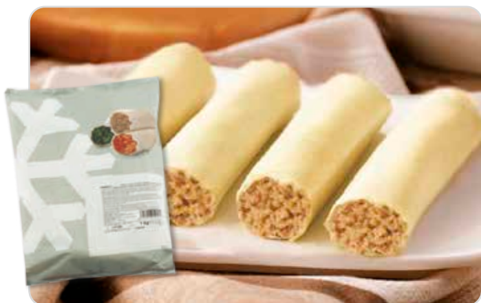
C-817 CANELONES DE CARNE (40 g/u) Caja: 100 Unidades / El kg le sale a 3,00 €

Canelones de carne sin bechamel, elaborados con finas láminas de pasta, la mejor selección de carne de ternera, cerdo y ave, cebolla, zanahoria, una pizca de nuez moscada y pimienta.