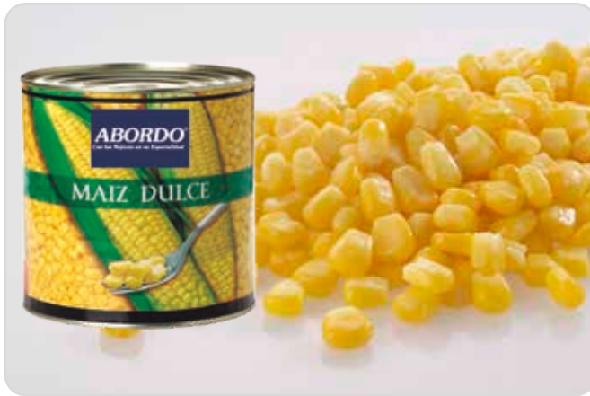
C-15307 MAIZ DULCE Lata 3 kg Caja: 6 Latas / El kg le sale a 0,92 €