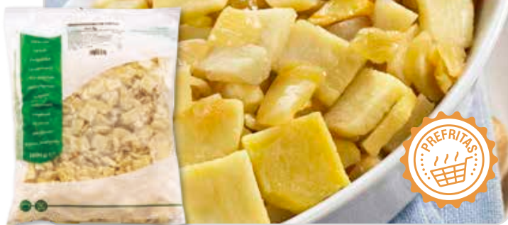
C-6050 MEZCLA PARA TORTILLA DE PATATA Y CEBOLLA