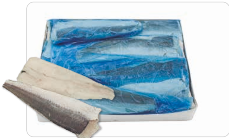
C-1029 FILETES DE MERLUZA (CON PIEL) (120/160 g/pza.)