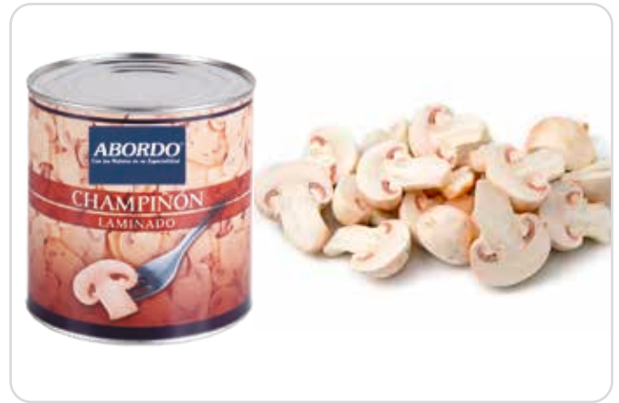
C-15338 CHAMPIÑÓN LAMINADO Lata 3 kg Caja: 6 Latas / El kg le sale a 1,22 €

Una buena forma de incorporar vegetales a la nuestra dieta y cubrir las necesidades de vitaminas y minerales que nos aportan, es el consumo de encurtidos.