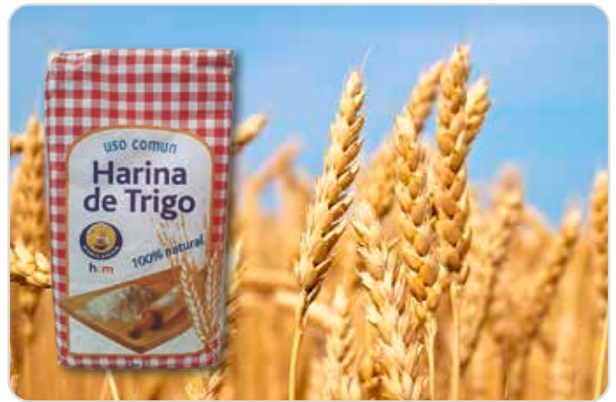
C-1447 HARINA DE TRIGO Paquete 1 kg Caja: 10 Unidades

Pisto, realizada con ingredientes naturales.