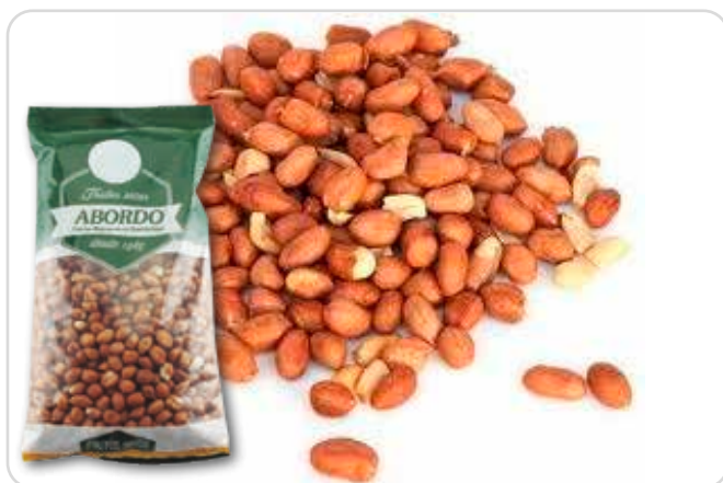
C-15324 CACAHUETE MONDADO CRUDO Bolsa 1 kg 1 Unidad

Recomendado para freír o tostar al gusto de cada uno y para repostería.