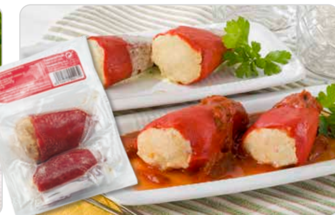
C-416 PIMIENTOS DEL PIQUILLO CON BACALAO (Bolsa 2 u.)