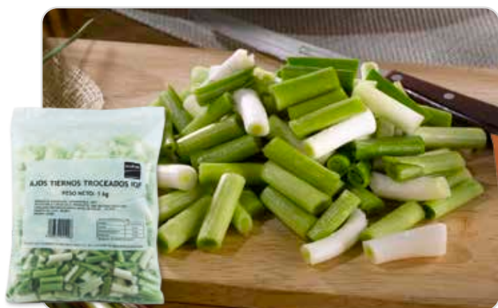
C-3592 AJOS TIERNOS TROCEADOS Bolsa 1 kg

Deliciosas, sanas y nutritivas. Nuestras guarniciones y entrantes son perfectos para la elaboración de platos con los mejores ingredientes para combinar o preparar en un sinfín de menús.