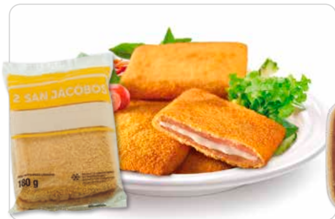
C-3071 SAN JACOBOS (2 x 90 g) Bolsa 180 g Caja: 28 Bolsas / El kg le sale a 2,95 € La unidad le sale a 0,21 €

Clásico San Jacobo de jamón y queso fundido. Delicioso para niños y mayores.