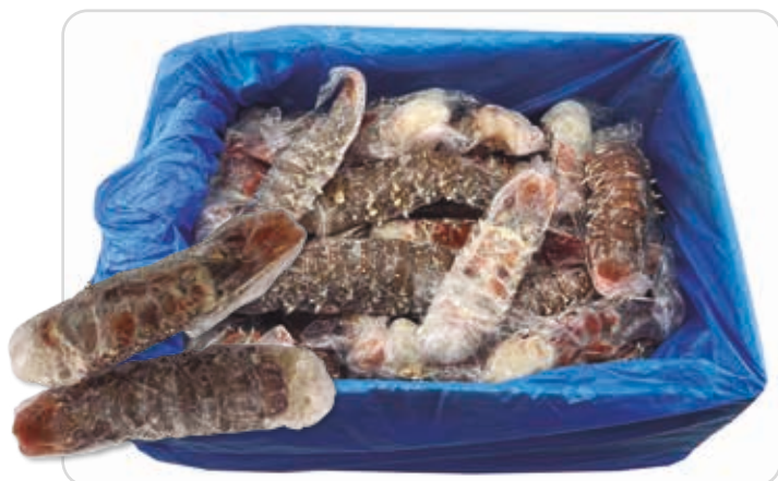
C-3625 COLAS DE LANGOSTA (100/300 g/pza.)