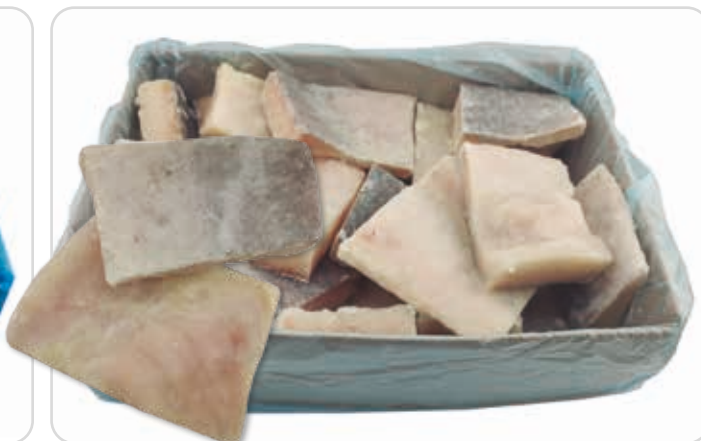
C-483 VENTRESCAS ENTERAS DE BACALAO GRIS (DESESPINADAS)