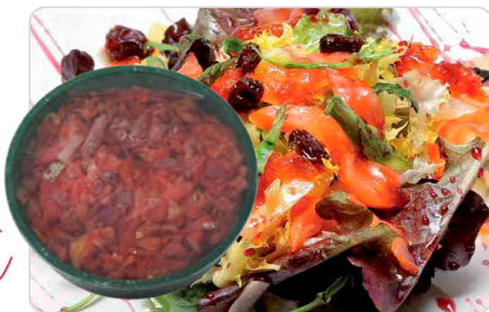
C-4487 ENSALADA DE AHUMADOS Tarrina 500 g

Elaboración artesana de todos nuestros productos.