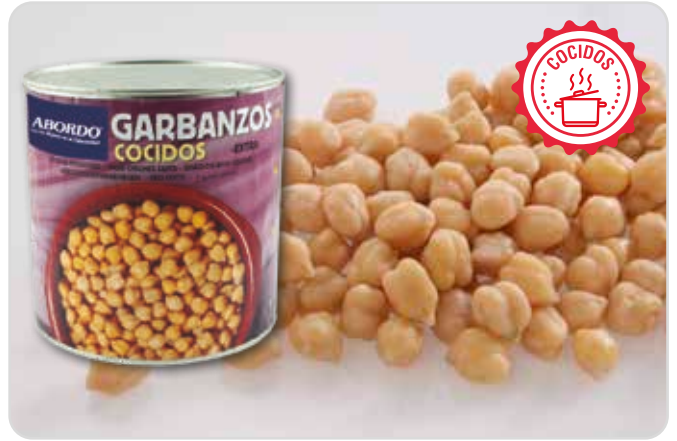
C-15333 GARBANZOS COCIDOS EXTRA Lata 3 kg Caja: 6 Unidades / El kg le sale a 0,65 €

Su textura, crujiente y su sabor naturalmente azucarado, lo convertirán en el ingrediente favorito de sus platos.