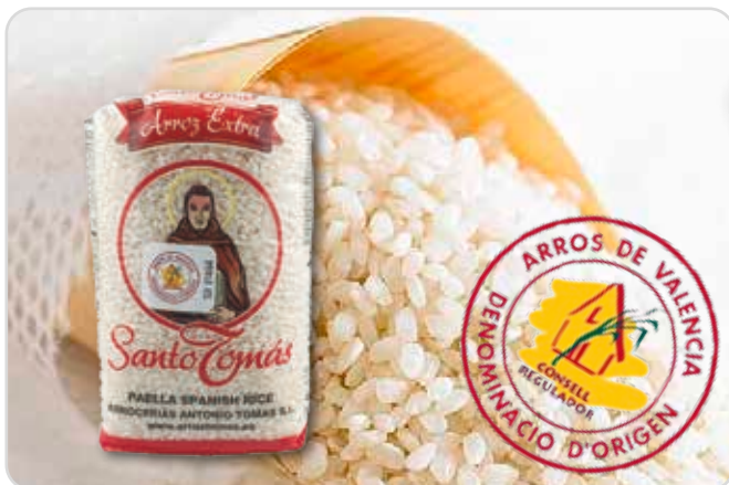
C-9779 ARROZ REDONDO Paquete 1 kg Caja: 10 Unidades

Nuestra Denominación de Origen exige el cultivo exclusivo de las variedades locales en el medio natural adecuado, con un sistema de riego que favorece la maduración homogénea del grano alcanzando la más elevada calidad industrial y culinaria.