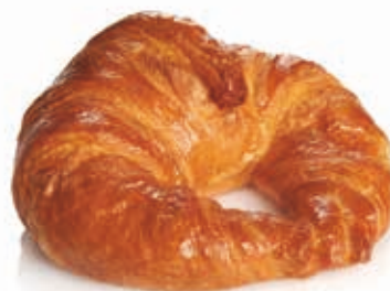
C-2713 CROISSANT GRANDE (85 g) Caja: 44 Unidades / El kg le sale a 3,18 €

Producto para hornear. Descongelar 30 min. Cocer en horno alrededor de 15 min. No es necesario pintar el producto.