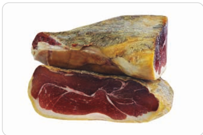
C-4357 JAMÓN DESHUESADO GRAN RESERVA +24 MESES (2 MITADES)