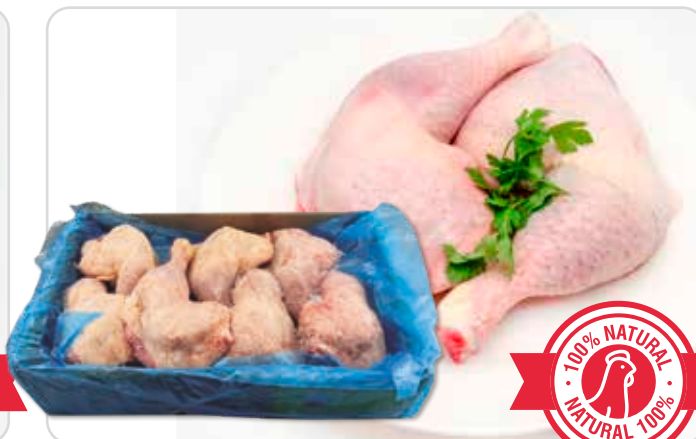
C-5509 CUARTOS TRASEROS DE POLLO (300/370 g/pza.)