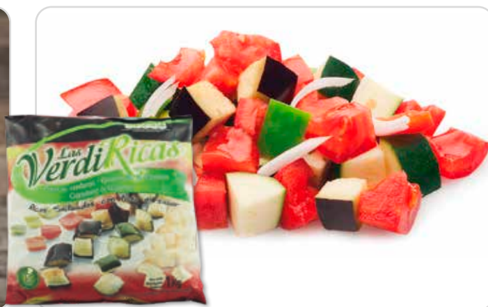
C-8239 PISTO DE VERDURAS Bolsa 1 kg