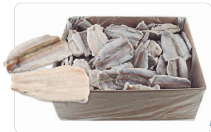
C-3341 FILETES DE BACALADILLA