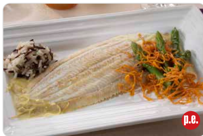
C-1235 LENGUADO RUBIO (300/400 g/pza.)