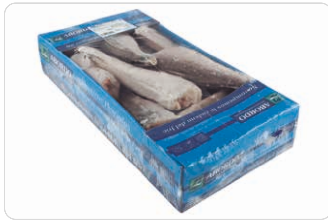
C-8134 PESCADILLA SIN CABEZA (TRONQUITO) (200/300 g/pza.)