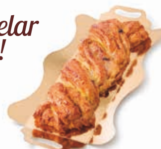
C-7701 TRENZA DE NUECES Y PASAS (500 g) Caja: 4 Unidades / El kg le sale a 11,90 €

Nueva trenza de masa hojaldrada a base de mantequilla fresca, rellena de una deliciosa crema pastelera artesana y frutos secos. Descongelar y consumir.