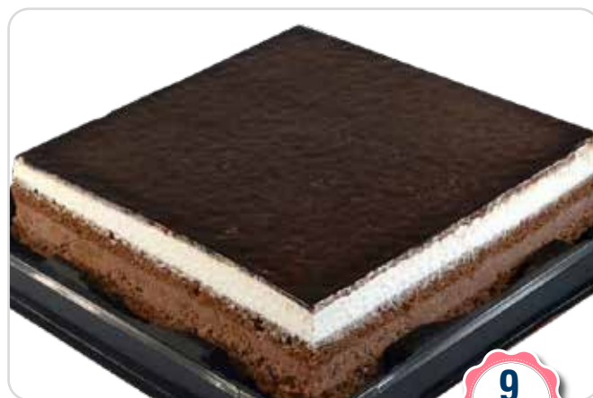
C-736 TARTA TRES CHOCOLATES (750 g)

Caja: 6 Unidades / El kilo le sale a 7,53 €