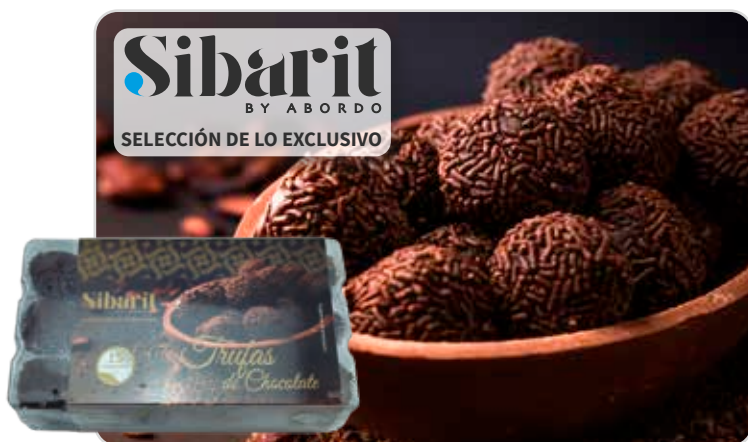
C-6328 TRUFAS DE CHOCOLATE (15 x 15 g) Estuche 225 g

Caja: 15 Estuches / El kg le sale a 11,78 €