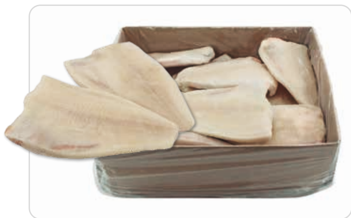
C-3128 LENGUADO LIMPIO (200/350 g/pza.)

La congelación sólo es un proceso de conservación que permite aumentar la vida útil de los alimentos, sin perder en lo más mínimo ninguno de sus componentes nutricionales.