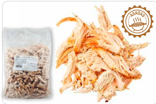
C-3513 TIRAS DE PECHUGA ASADAS (0,6 x 6 cm/pza.)

Bolsa: 2,5 kg / La bolsa de 2,5 kg le sale a 18,63 €