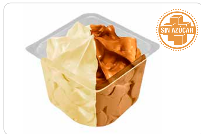
C-7649 VASITOS DE VAINILLA Y CHOCOLATE (SIN AZÚCAR) (4 x 130 ml) Caja: 12 Unidades / El litro le sale a 3,08 € La unidad de 130 ml le sale a 0,40 €

Delicioso y suave helado sin azucar de vainilla y chocolate. Muy suave y refrescante.