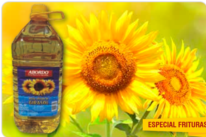
C-14263 ACEITE REFINADO DE GIRASOL Garrafa 5 L Caja: 3 Unidades / El litro le sale a 1,53 €

Son aspectos importantes de las conservas mantener o mejorar los valores nutricionales, la textura y el sabor. Menores tiempos de cocción, facilidad de transportar y abrir, beneficios ambientales, vida de anaquel comparable a las latas, para uso en horno de microondas, etc.