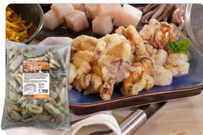
C-159 FRITURA ENHARINADA PREMIUM Bolsa 1 kg