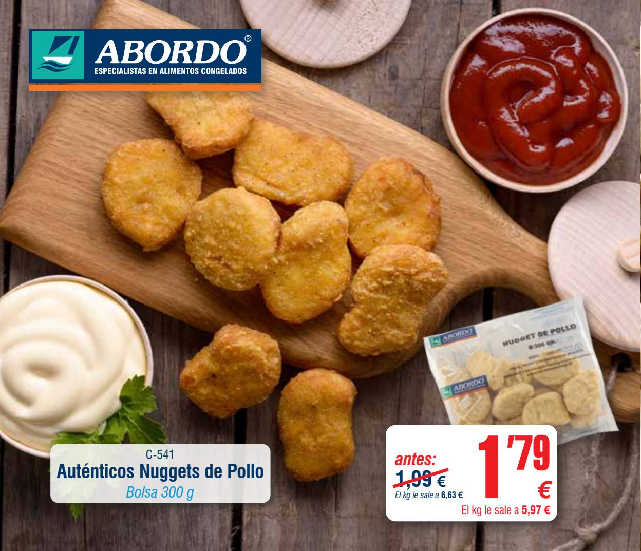
C-541 Auténticos Nuggets de Pollo Bolsa 300 g

antes: 1,99 € El kg le sale a 6,63 € 1'79 € El kg le sale a 5,97 €