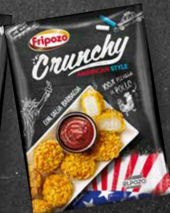
C-2085 Crunchy de Pollo Bolsa 300 g