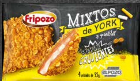
C-2080 Mixtos Crujientes York y Queso (4 x 95 g) Bolsa 380 g