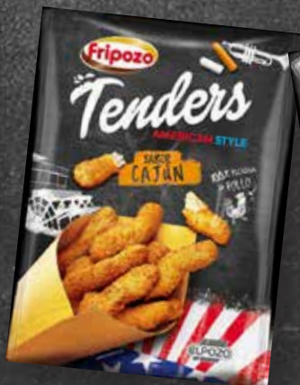
C-2082 Tenders de Pollo Sabor Cajun Bolsa 250 g