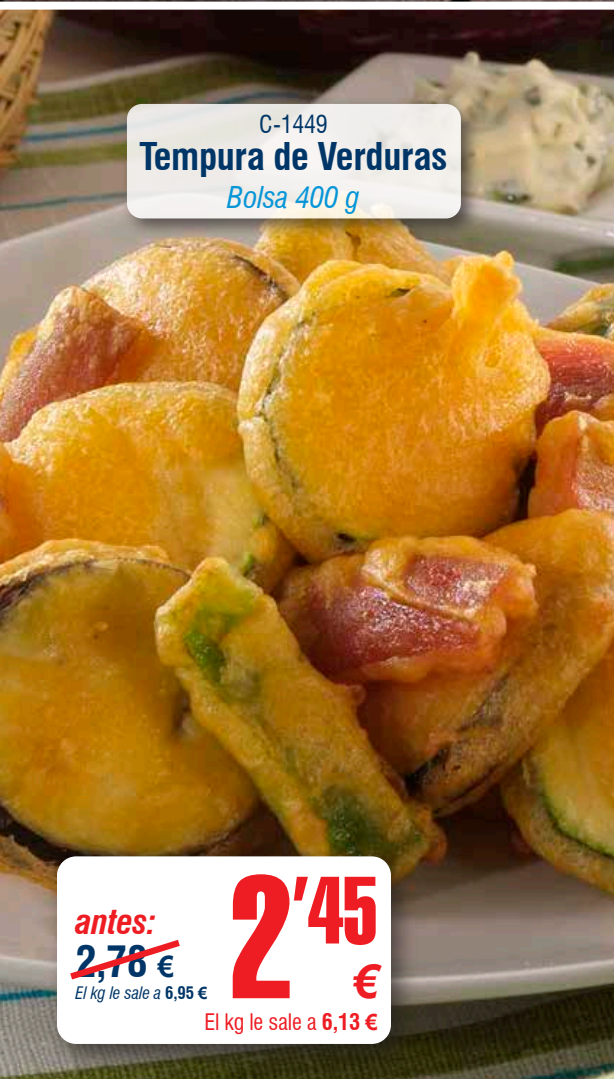
C-1449 Tempura de Verduras Bolsa 400 g

antes: 1,99 € El kg le sale a 6,63 € 1'79 € El kg le sale a 5,97 €