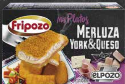
C-535 San Jacobos de Merluza, York y Queso (4 x 90 g) Estuche 360 g