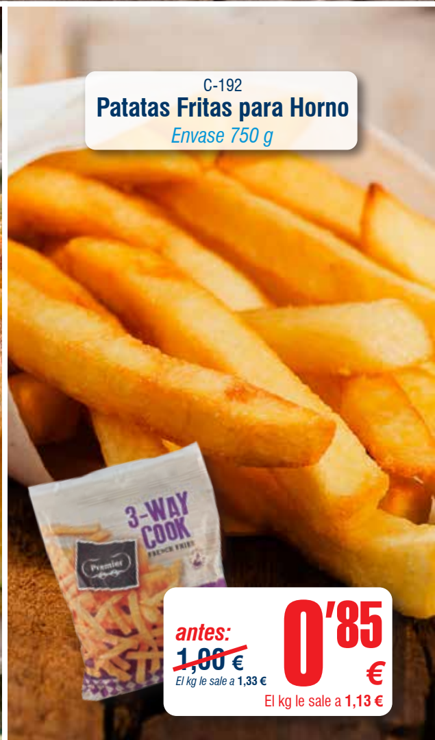
C-192 Patatas Fritas para Horno Envase 750 g

antes: 2,76 € El kg le sale a 6,95 € 2'45 € El kg le sale a 6,13 €