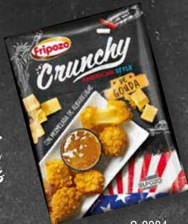
C-2084 Crunchy de Gouda Bolsa 300 g

Recetas elaboradas inspiradas en la gastronomía del mundo, la comida finger food y los food trucks. Listos para cocinar y sorprender a tu paladar y al de tus invitados. Ingredientes naturales convertidos en Tenders, Crunchys, Calentar y Listo, Mixtos, Mucho más Sano. La receta del éxito en tus platos.